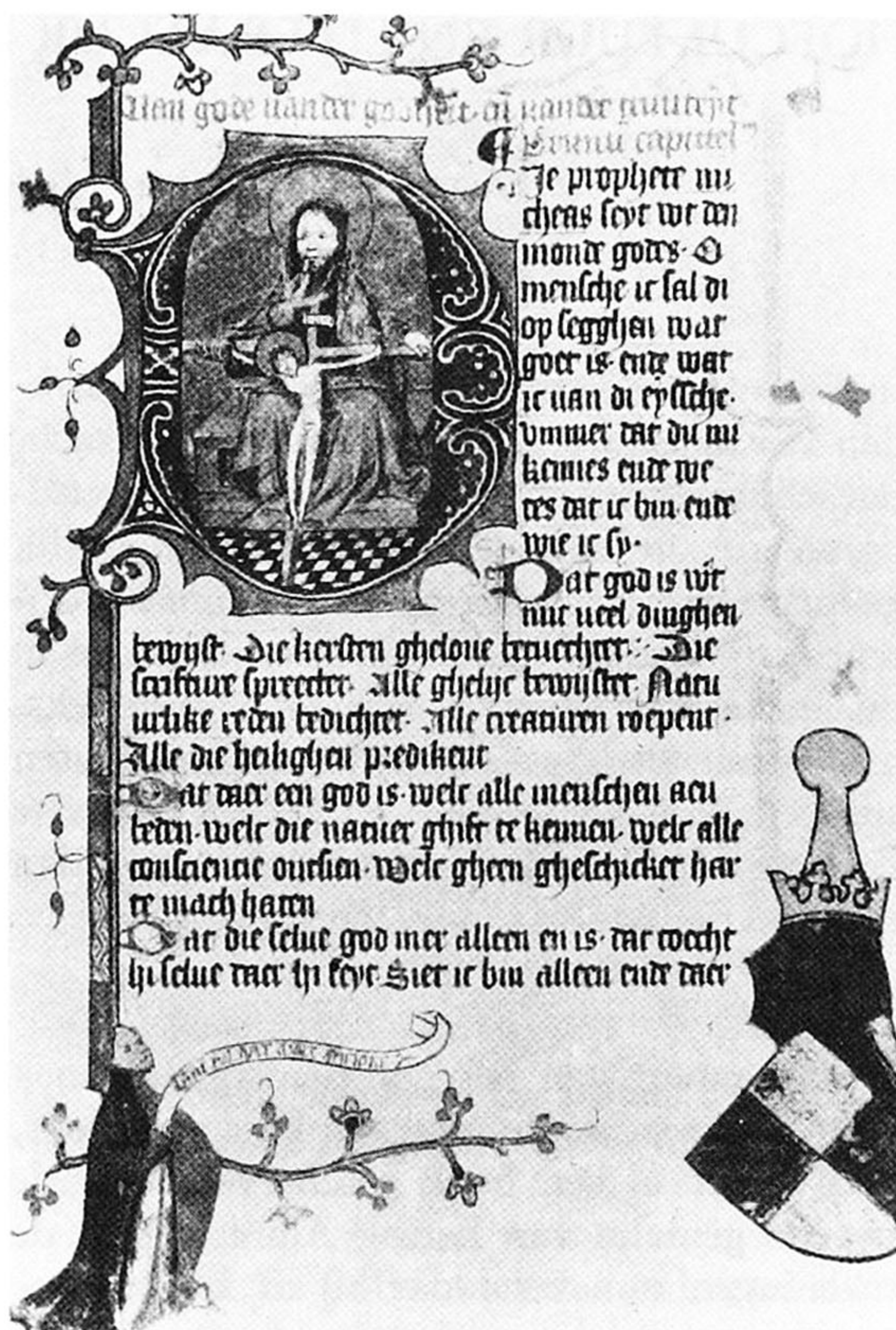
„Tafel van den kersten ghelove”; het opdrachtexemplaar (linksonder de auteur, rechtsonder het wapen van Albrecht van Beieren).

Maar voor een literatuurhistoricus zijn natuurlijk vooral de gegevens van belang die de rekeningen prijsgeven omtrent de boeken en de teksten aan het hof. Een hofbibliotheek in heuse zin beheerde men waarschijnlijk niet; wel spreken de rekeningen soms van een kist , of een kistkijn (kistje) waarin mijns heren boeken worden geborgen. Vrij zeker blijkt alleen al hieruit dat onze graven konden lezen - wat al meer is dan men van menig middeleeuws vorst kan zeggen, ook al zijn de tijden dat aristocraten zich nog konden permitteren analfaabeet te zijn omstreeks 1400 wel voorbij, en citeert men - ook in de Hollandse teksten - steeds vaker het adagium dat „een ongeleerde koning hetzelfde is als een gekroonde ezel”. Wat lazen de heren dan zoal? In de eerste plaats uiterst geheime brieven, waarvan de risico's toenamen naarmate ze onder meer ogen kwamen. Normaal gesproken werd de post aan vorsten voorgelezen; maar soms vinden we vermeldingen van heymelike brieve die min here selve las of ook wel screef . Maar wat zou toch de inhoud van de grafelijke boekenkist(jes) zijn geweest? Een inventaris is hier niet bewaard, zodat we zijn aangewezen op „circumstantial evidence”. Een enkele keer maken de rekeningen melding van de aanschaf van gebeden- en getijdenboeken; dit overigens meestal voor de vrouwelijke leden van de gra-