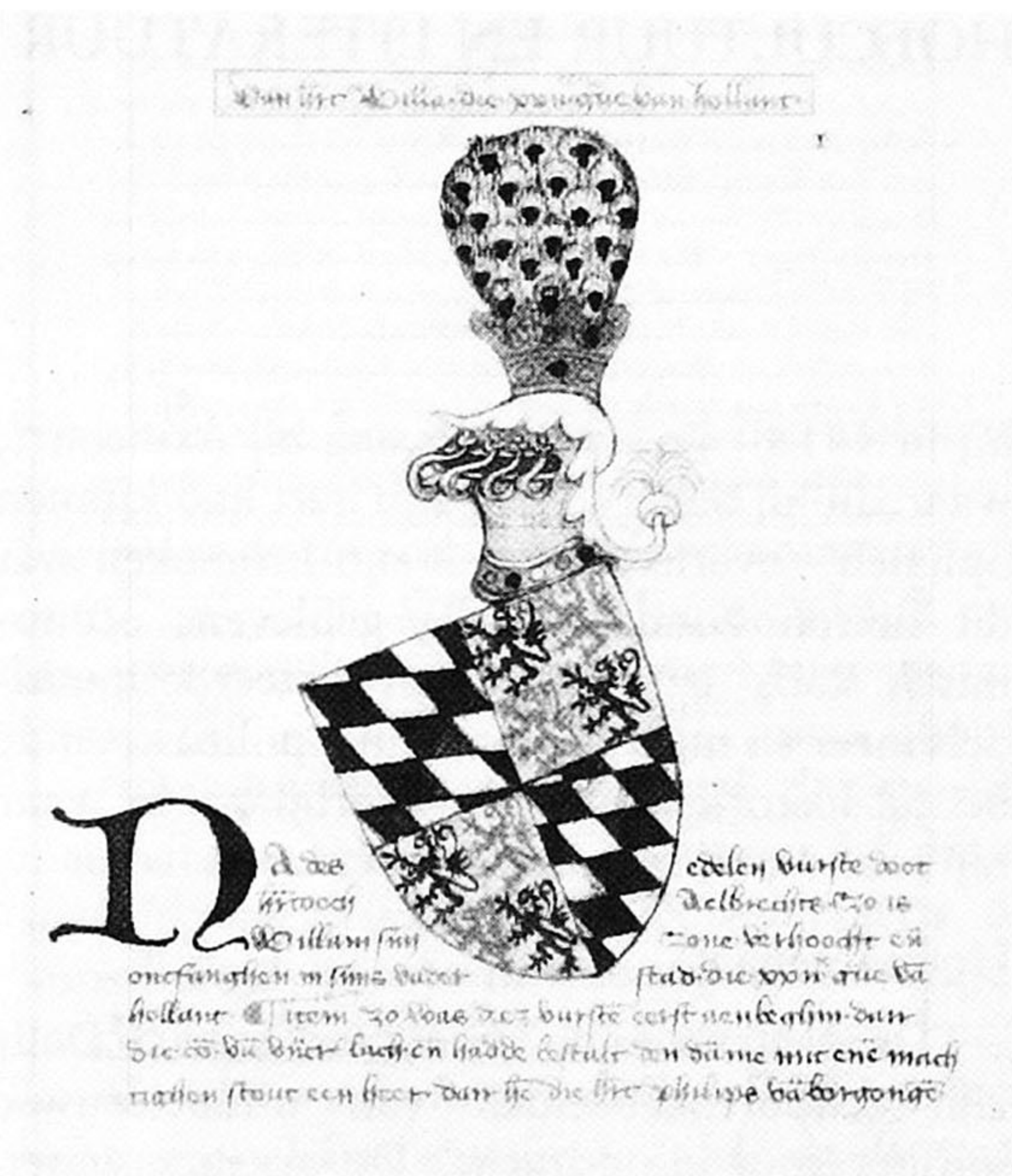
De „Hollandse kroniek” van heraut Beieren; het opdrachtsexemplaar, met wapen- en schildteken van Willem VI.

Onder de herauten was de opperheraut van Albrecht en Willem VI, ook internationaal gezien, een van de meest gezaghebbende, zoals ook zijn geschreven oeuvre behoort tot de belangrijkste die van herauten zijn bewaard gebleven. Aan het Hollands-Beierse hof schreef deze heraut Beieren - zoals men hem naar zijn toenmalige territoriale ambtsnaam aanduidt - vooral kronieken, in casu een soort tweeluik dat enerzijds de geschiedenis van heel de wereld, en anderzijds meer speciaal die van het graafschap Holland behandelde. Voor deze kronieken raadpleegde de auteur een overvloed aan bronnen, waaruit hij, om de omvang van zijn stof binnen de perken te houden, streng moest selecteren. Als wij zijn bronnenarbeid narekenen, zien we nog scherper dan wanneer we enkel zouden lezen in het resultaat - de twee kronieken zelf - hoe sterk de Heraut de geschiedenis kleurt vanuit zijn eigen perspectief. Wereldgeschiedenis is voor hem in de eerste plaats de geschiedenis van vorstenhuizen, en meer speciaal van vorsten als ze vechten. Natuurlijk is een vrede-rijck ook voor de Heraut een ideaal; maar om zo'n vrede-rijck te vestigen moet men met de wapens kunnen