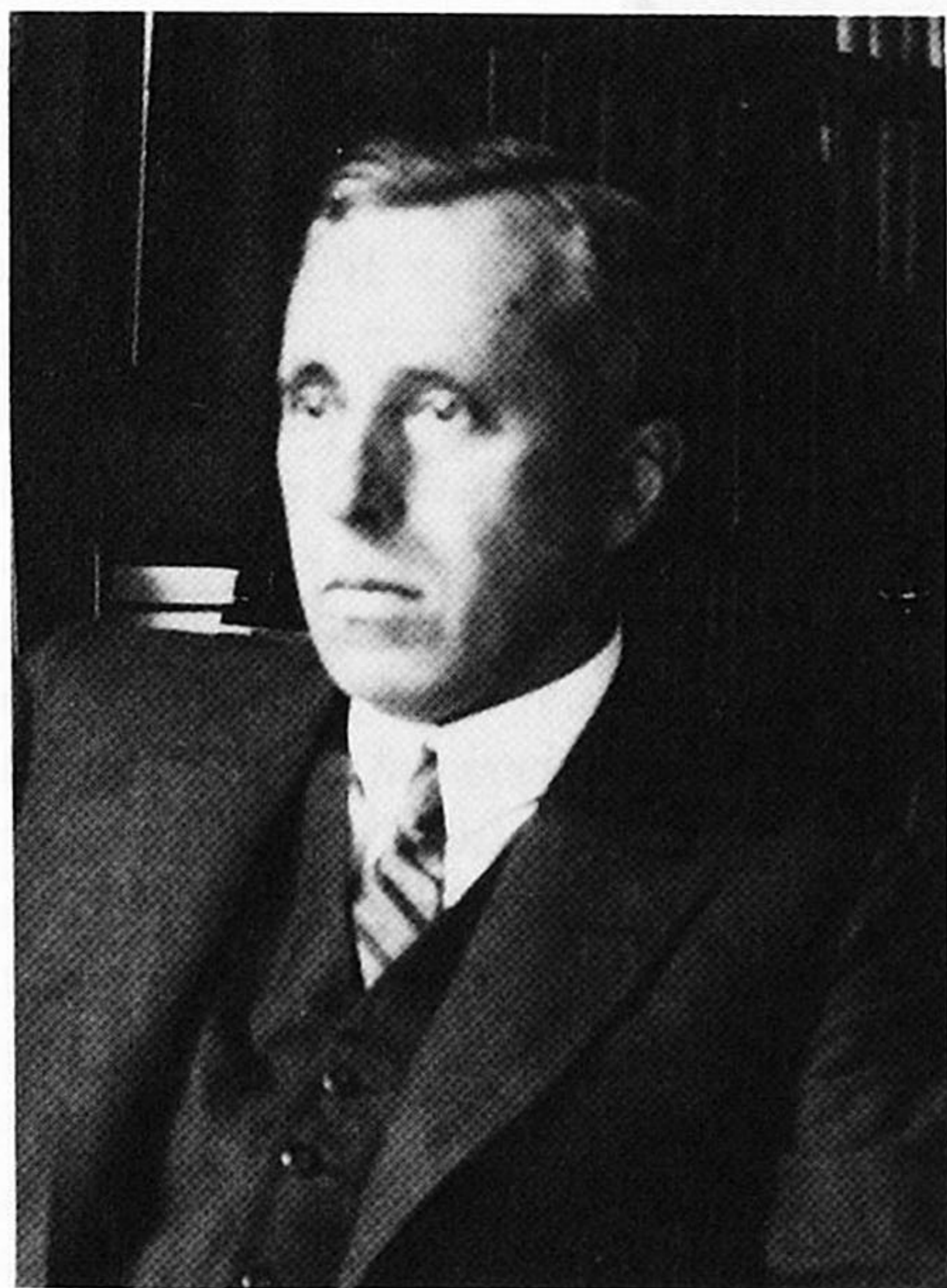
Johan Huizinga (Huizinga- Briefwisseling I , p. 429)

Zo kwamen zij die in de objectivering der historische wetenschappen het heil zagen, van een nogal koude kermis thuis. Niet dat de bijdrage vanuit sociaal-wetenschappelijke hoek zich ooit nog zou laten wegcijferen; want al met al heeft het historisch bedrijf wel degelijk een gedaanteverandering ondergaan die naar het zich laat aanzien fundamenteel is. Het getal is uit de geschiedwetenschap niet meer weg te denken, en ook menige vlotte essayist probeert zijn visies cijfer-