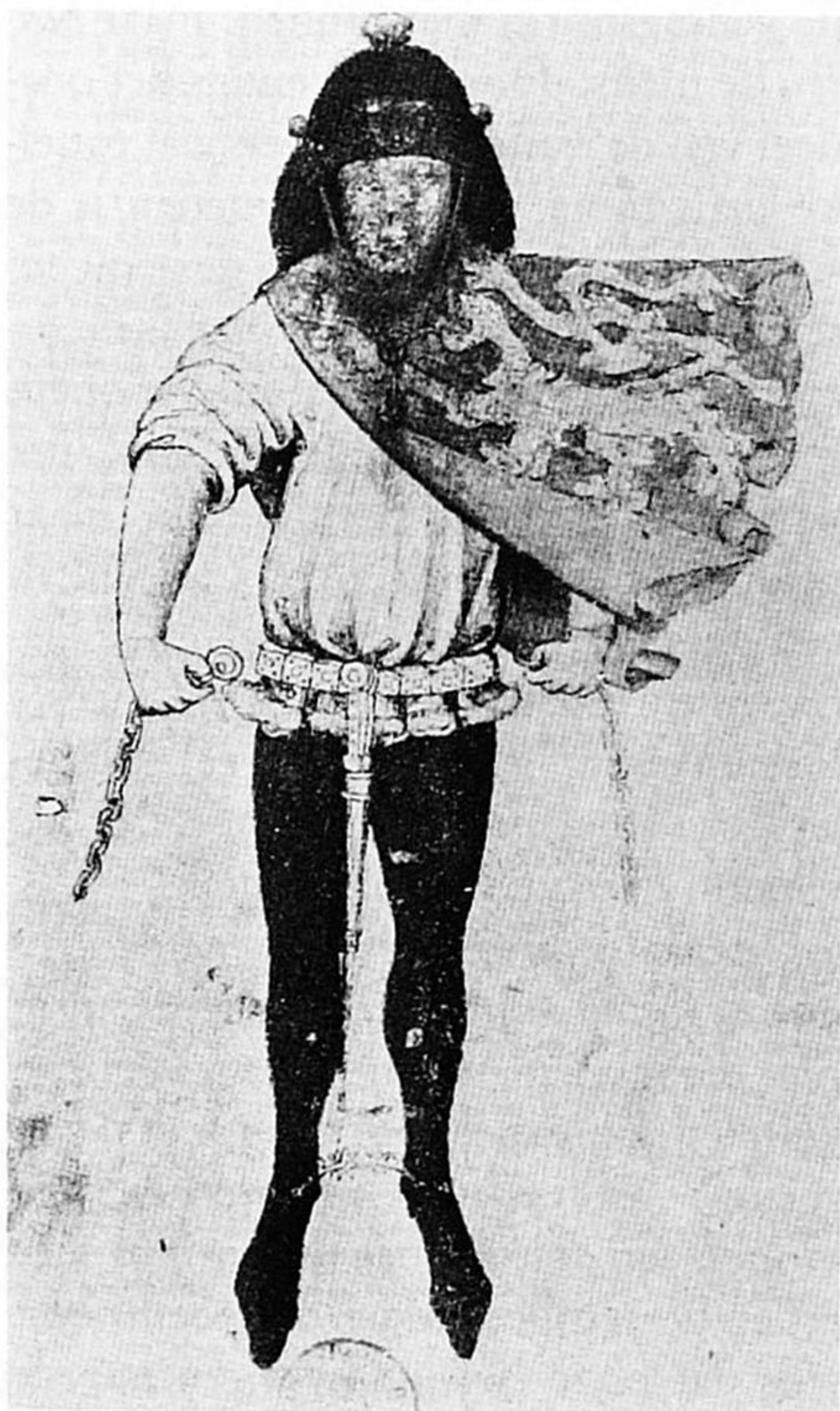
Heraut Beieren. (Zelf?)portret uit de tijd dat hij nog als heraut (in) Gelre fungeerde (zie Literatuur 2/1985, p. 244-251)

Geen groter contrast is denkbaar dan tussen deze voor ons zo karakteristieke figuur van de militair gewetensbezwaarde en de mentaliteit van de Hollandse hofauteur die als geen ander eer in het vaandel voert: de zogenaamde heraut Beieren. Als heraut is deze auteur een soort van hogepriester van de ridderschap, belast met de bewaking van het rijke ceremonieel rondom toernooien, ridderwijding en militaire begrafenissen. Zijn mentaliteit is geheel overeenkomstig: een man van eer hoort op het veld van eer, en de ware dood is die op het slagveld. Niet dat die dood het doel van het leven is, maar veel scheelt het niet: het doel van het leven is eer, en het aangewezen middel daartoe is vechten. Het advies van de