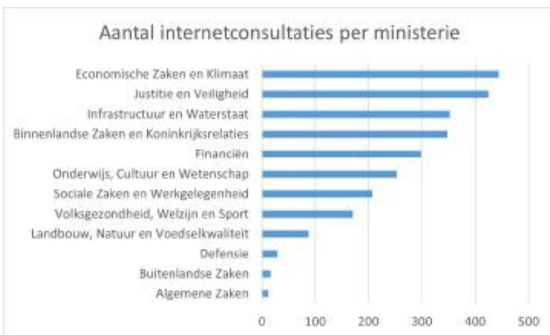
Figuur 2 Aantal internetconsultaties per ministerie tot en met 12 februari 2023

De meeste consultaties vinden plaats bij de vakdepartementen van Economische Zaken en Klimaat, Justitie en Veiligheid, Infrastructuur en Waterstaat en Binnenlandse Zaken en Koninkrijksrelaties (inclusief volkshuisvesting). Het sociale domein van onderwijs, sociale zaken en zorg consulteert aanzienlijk minder (zie figuur 2). Naast consultaties van wetsvoorstellen zien we ook consultaties ten behoeve van beleidsnota's en evaluaties. Ook toezichthouders gebruiken de website ter consultatie van toezichtkaders, zoals de Inspectie van het Onderwijs of beleidsregels, zoals de Autoriteit Consument en Markt.