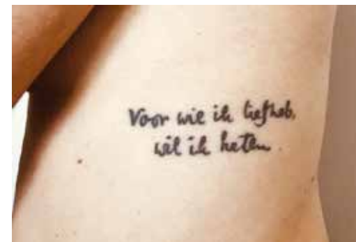
Afbeelding 1. Sandra

Bij het vak Nederlands kunnen de leerlingen vervolgens aandacht besteden aan citaten die veel voor hen betekenen, op manieren die ik hierboven uiteenzette. Tijdens beeldende vorming en ckv kunnen ze dan visueel met die citaten aan de slag gaan. Welke vormgeving past bij die woorden? Welk lettertype en welke grootte en kleur? Waarom? Past er een bepaalde illustratie bij? In welk ontwerp pakt de combinatie tussen woord en beeld