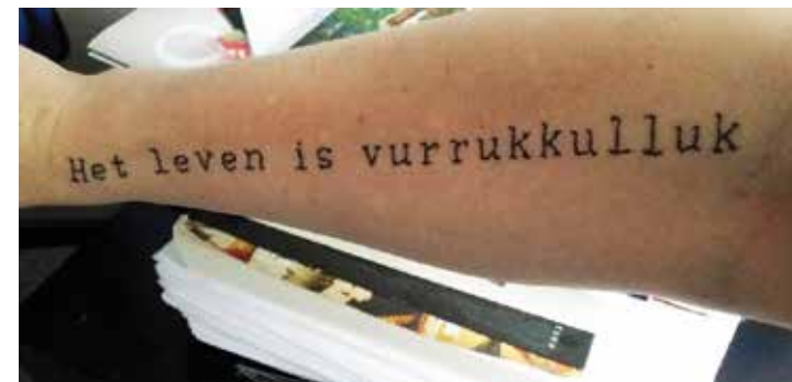
Afbeelding 2. Luuk

Poëzietatoeages zijn ook een geweldige aanleiding om een vakoverstijgend project op te zetten op school