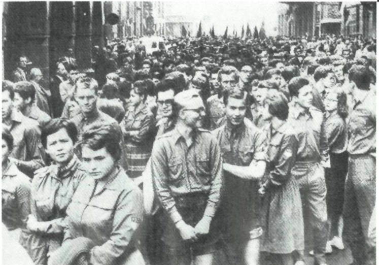
Oost-Duitse jongeren waren verplicht lid van de Freie Deutsche Jugend.

Voortaan meed de SED-top een directe confrontatie met de kerken en concentreerde zich sterker op het ideologische dispuut met het christendom. Met de introductie van de Jugendweihe in 1954 had het regime een middel gevonden om de jongeren van de kerk en het christendom te vervreemden. De Jugendweihe was een plechtigheid die officieel de overgang van een kind naar het volwassen lidmaatschap van de socialistische samenleving markeerde. Jongeren die vanwege gewetensbezwaren de Jugendweihe meden hoefden niet te rekenen op een stage- of studieplaats. Uiteindelijk verloren de kerken de strijd tegen deze concurrent van de kerkelijke confirmatie.