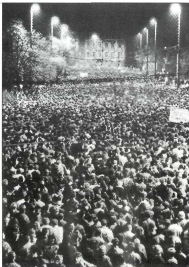
Maandagsdemonstratie in Leipzig op 16 oktober 1989.

1. De SPD was in 1946 gedwongen samengegaan met de KPD in de SED.