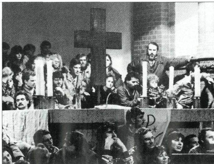
Kerkdienst voor de tijdens de Rosa-Luxemburgmars gearresteerde demonstranten in de Oost-Berlijnse 'Gethsemane-Kirche'.

In mei 1989 legden oppositionelen het politieke en morele bankroet van het SED-regime bloot. Tijdens de gemeenteverkiezingen bewaakten zij in verschillende steden de stemlokalen constateerden zij dat er op grote schaal gesjoemeld werd. Nieuw was dat dit al lang bekende kiezersbedrog nu voor het eerst openlijk aan de kaak werd gesteld. Door dit protest werd het politiek-morele failliet van de regering voor iedereen duidelijk zichtbaar en groeide de oppositie. Na de onofficiële opening van de Oostenrijks-Hongaarse grens op twee mei nam het aantal personen dat 'stemde met de voeten' onrustbarend toe. Veel kritische dissidenten en kerkelijke leiders beschouwden de vluchtelingen als verraders. Zij vonden dat de DDR van binnenuit hervormd moest worden. Toch werd juist door de massaliteit van het aantal DDR-burgers dat wenste te vertrekken de speelruimte voor de oppositiegroepen en voor verzet vergroot.