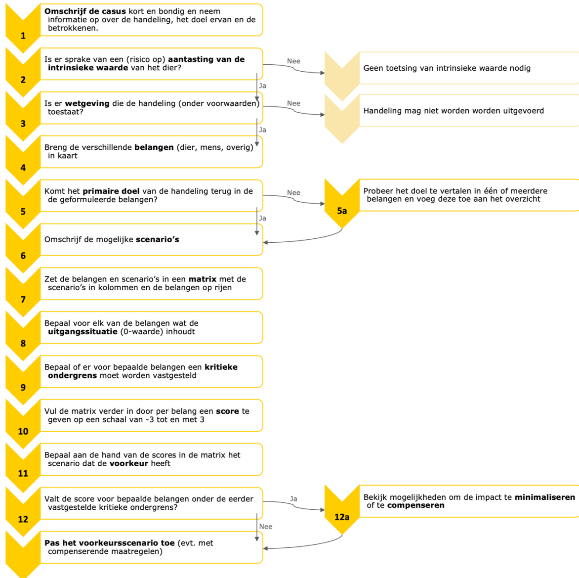
Figuur 2: stappenplan voor het maken van de belangenafweging rond de intrinsieke waarde van dieren. Opgesteld door CenSAS in opdracht van het Ministerie van LNV.

Hieronder is in figuur 1 het stappenplan weergegeven. Onder figuur 1 is per stap een toelichting gegeven. Wij raden aan deze toelichting ook naast het stappenplan te houden.