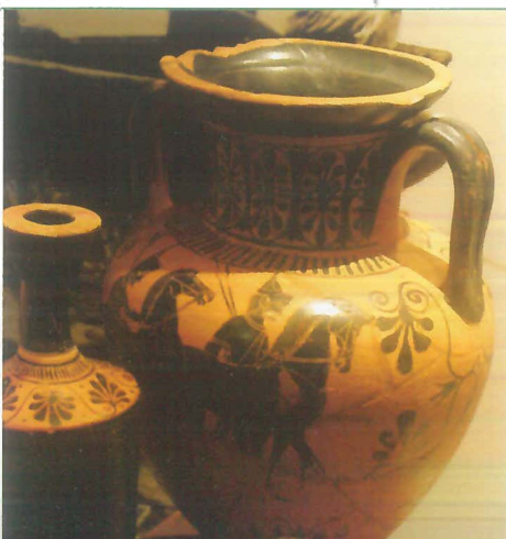
Afb.3 Zwartbuikige Amfoor (530-490 voor Chr.) inv.nr: Arch 278