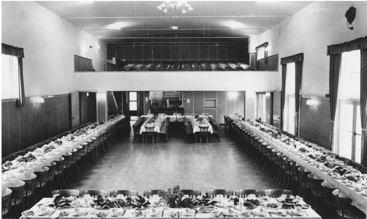
Abbildung 8: Saal des Hotel-Cafés De Engel in Baarle-Nassau, Werbepostkarte aus den 1950er Jahren. Dieses Multifunktionskino war mit flexiblem Mobiliar im Erdgeschoss ausgestattet, so dass es für unterschiedliche Zwecke genutzt werden konnte. Auf dem Bild sind die Tische für ein festliches Essen hergerichtet. Man beachte die Balustrade, die Verdunkelungsvorhänge sowie die Theke im Hintergrund.