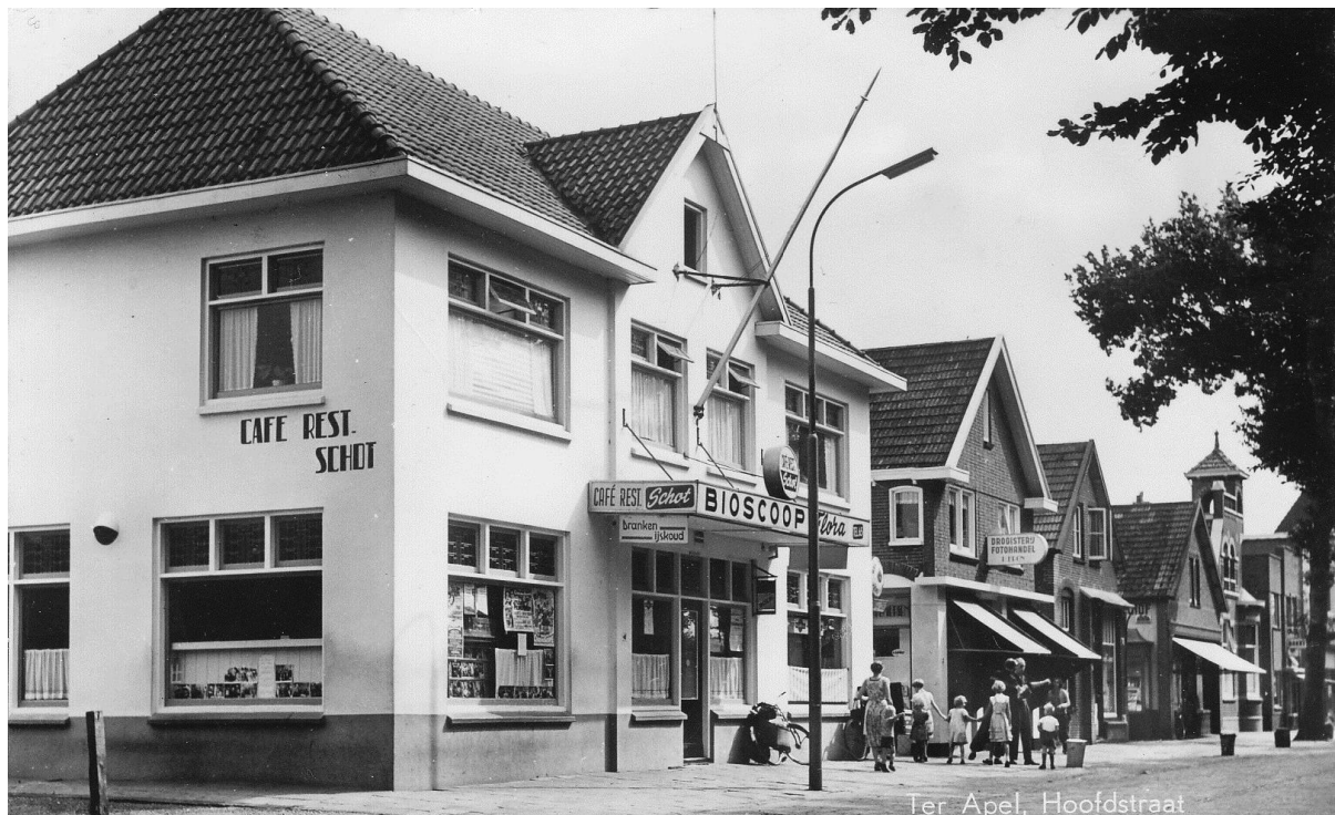
Abbildung 5: Café-Restaurant Schot an der Hauptstraße von Ter Apel, 1955. Auf dem Programm steht der Film The Student Prince (USA 1954).