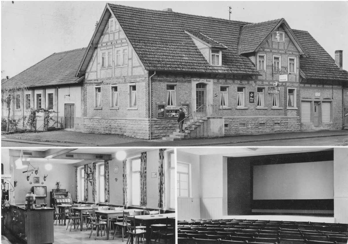
Abbildung 10: Gasthof Zur Rose in Seckach mit seinem Kino, ca. 1955. Man beachte den Fernseher sowie die Jukebox im Gastraum.