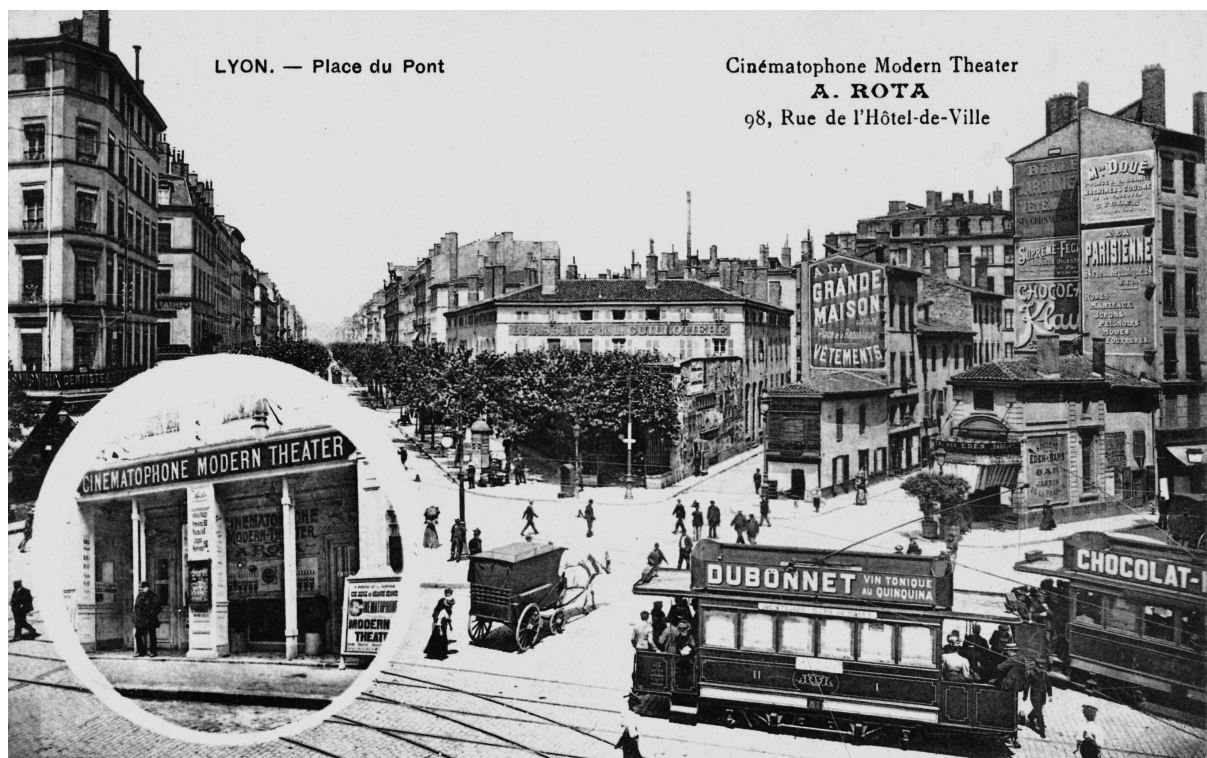
Abbildung 1: Reklamepostkarte für das Cinématophone Modern Theater in Lyon. Teil einer Serie von zwölf Ansichtskarten, die von diesem Kino in Umlauf gebracht wurden, ca. 1908.