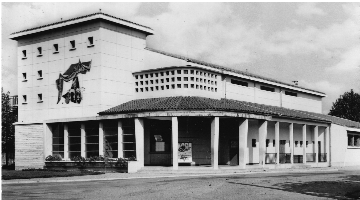
Abbildung 9: Le Sully , Salle des Fêtes und Gemeindokino, Coutras (Gironde). Das Gebäude wurde im Jahre 1957 eröffnet.