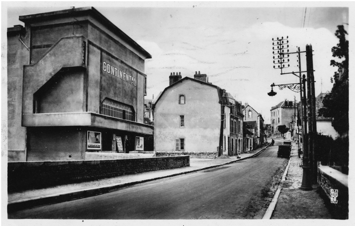
Abbildung 3: Cinéma Continental in Guéret (7.890 EinwohnerInnen im Jahre 1931). Gezeigt wird La Châtelaine du Liban von Jean Epstein (Frankreich 1933).