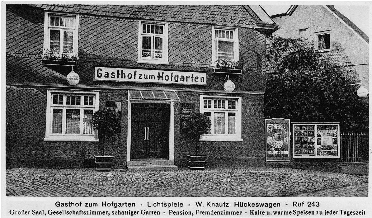
Abbildung 4: Gasthof Zum Hofgarten , Hückeswagen. Gezeigt wird der Film ... nur ein Komödiant (Österreich 1935).