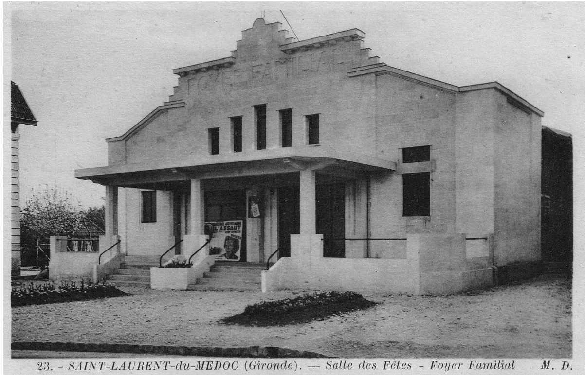
Abbildung 2: Salle des Fêtes , Saint-Laurent-du-Médoc, etwa 1937