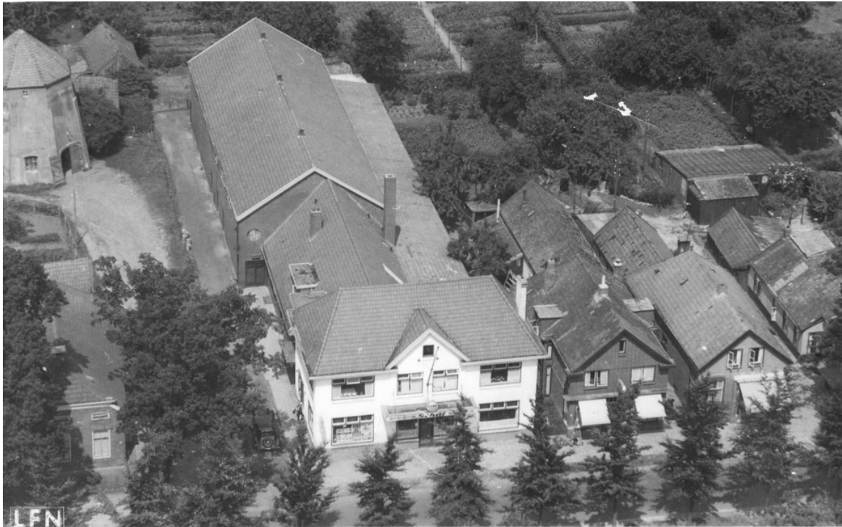
Abbildung 6: Luftaufnahme des Café-Restaurants Schot mit dem großen Saal auf der Rückseite, der als Kino genutzt wurde. Man beachte die alte Kornmühle oben links.