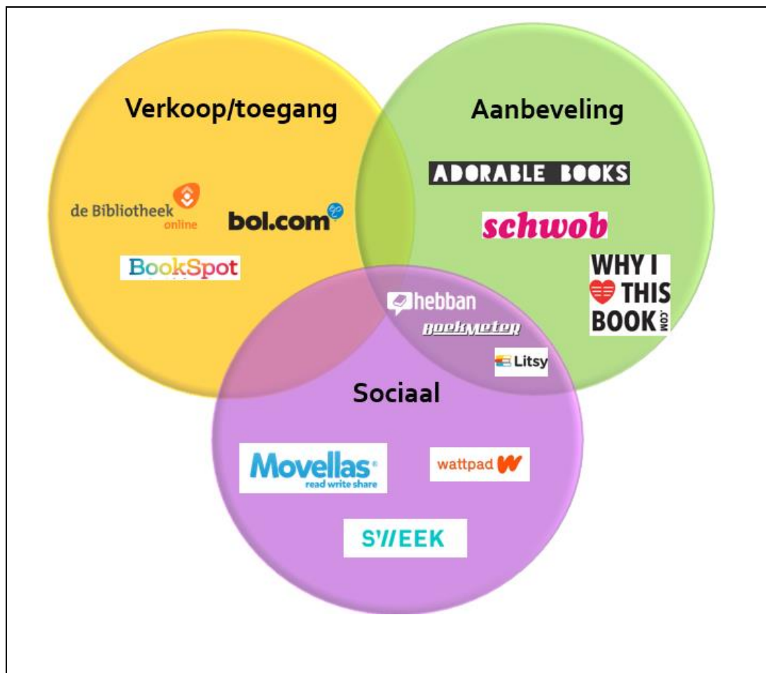
Figuur 1. Overlap in categorieën tussen platforms.

Ook binnen de categorie 'sociaal' heeft het merendeel van de platforms, naast de primaire functie, een secundaire functie. Van de 10 platforms die primair bedoeld zijn voor 'sociale interactie omtrent lezen', hebben 6 platforms als secundaire functie 'aanbeveling'. Van de 13 platforms met als primaire doel 'sociale interactie omtrent schrijven' overlappen er 10 met de categorie 'sociaal lezen'. Figuur 2 geeft een indruk van deze overlap in functie van platforms.