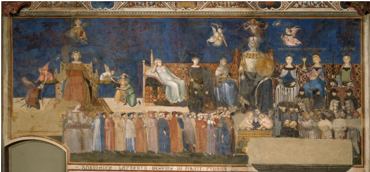
Afbeelding 1. Lorenzetti's Goed Bestuur , centrale wand.

Een ander beeld van het besturen dat zich al heel lang in Tons belangstelling mag verheugen is Benthams panopticon. 8 In zijn allereerste academische publicatie, geschreven samen met zijn vrouw Tineke Cleiren, legt Ton uit dat het daarbij gaat om een architectonisch model voor gevangenissen, psychiatrische inrichtingen en werkplaatsen dat maximale controle mogelijk maakt met minimale middelen. 9 Het panopticon is een ringvormige constructie met een wachttoren in het centrum en afzonderlijke cellen in de schil van het gebouw. Vanuit de toren hebben bewakers onbelemmerd zicht op de personen in de cellen die andersom hun bewaker niet kunnen zien. Een efficiëntere vorm van menshouderij is volgens Bentham niet mogelijk. Ten eerste is het natuurlijk handig dat de bewakers niet de hele tijd heen en weer hoeven te lopen; vanuit de centrale toren is het immers mogelijk alle personen in de cellen tegelijk in de gaten te houden. En misschien nog wel belangrijker: voor een efficiënte controle is permanente bezetting van de toren niet eens nodig. De wetenschap van de personen in de cellen dat de toren bemand zou kunnen zijn is voldoende. Op die manier wordt ruimte geschapen voor een automatisch functioneren van de macht dat mede steunt op de opgeslotenen zelf. 10