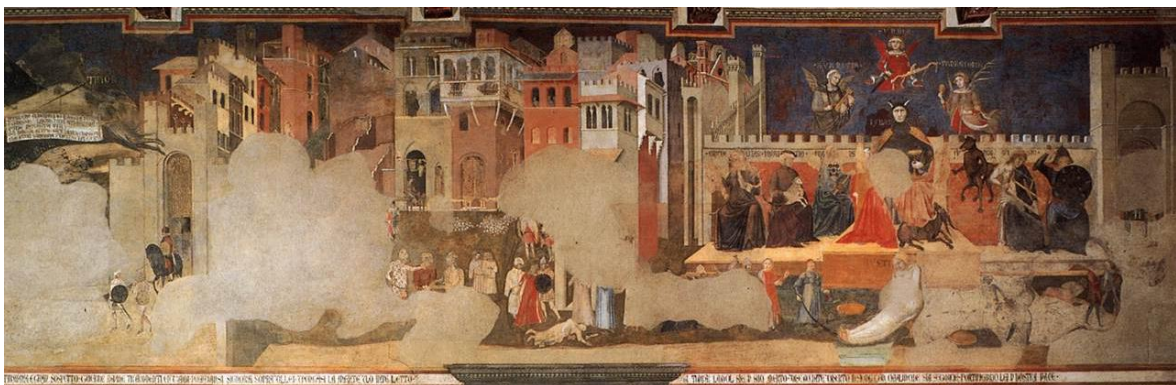
Afbeelding 5. Lorenzetti's Goed Bestuur , zijwand: de gevolgen van slecht bestuur in de stad en op het platteland.

Wat slecht bestuur in de stad en het ommeland teweeg kan brengen, toont ons de tegenovergestelde wand van de raadzaal (afbeelding 5). Ook daar ontwaren we de gestalte van een mooie jonge vrouw als de verpersoonlijking van de Gerechtigheid. Dit keer spant zij geen koord dat anderen in toom houdt, maar ligt zij zelf gekneveld aan de voeten van een monsterachtige duivel die de tirannie uitbeeldt en zich laat leiden door Hoogmoed, Hebzucht en Ijdelheid. Een miezerig groepje omstanders kijkt wellustig toe hoe Gerechtigheid ervan langs krijgt met een dubbele zweep. Elders in de stad wordt een vrouw beroofd en ligt het lijk van een eerwaardig burger te rotten in het stof. Geen wonder dat er in de stad verder weinig gebeurt en de meeste mensen zich angstvallig verschuilen in hun huizen. Op het platteland staan de zaken er al even slecht voor. De velden en akkers blijven onbewerkt en liggen er dor en verlaten bij. Rondtrekkende bendes steken dorpen in brand en overvallen onschuldige reizigers. Kortom: waar Gerechtigheid van haar hoge troon is verstoten resteert slechts een afschuwwekkende oorlog van allen tegen allen. Het menselijk bestaan is er eenzaam, armoedig, afstotelijk, beestachtig en kort.