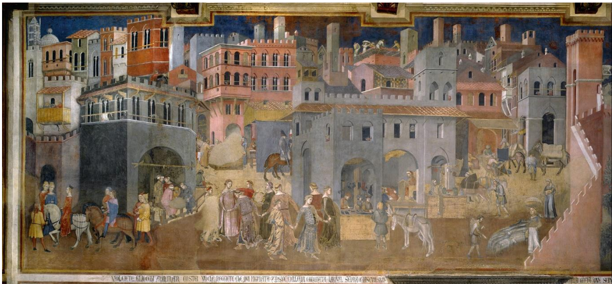
Afbeelding 3. Lorenzetti's Goed Bestuur, zijwand: de gevolgen van goed bestuur in de stad.

De sterke nadruk op rechtvaardigheid op de schilderingen in de raadzaal van het stadhuis van Siena betekent niet dat praktisch nut daar buiten beeld blijft. Integendeel: een fresco op een van de zijwanden toont ons hoe ordentelijk bestuur de welvaart bevordert en de goede vrede onder de burgers bewaart (afbeelding 3). Binnen de muren van Siena floreren handel, nijverheid en onderwijs. Op het centrale plein van de stad vinden dansers elkaar in harmonieuze samenhang en een ingewikkelde choreografie waarin de S van Siena valt te ontdekken. 14 Op het platteland gaat het er even idyllisch aan toe (afbeelding 4). We zien een zonoevergoten landschap met wuivende graanvelden, zware wijnstokken en schaduwrijke olijfgaarden – zo'n beetje het beeld van Toscane dat ons tegenwoordig wordt voorgeschoteld in vakantiefolders en televisiereclames voor pasta of olijfolie. Maar toch: al die voorspoed is weliswaar het effect , maar niet in de eerste plaats het object van het goede bestuur. Vanaf haar troon op het centrale fresco lijkt de verpersoonlijkte Gerechtigheid van de wereld aan haar voeten nauwelijks iets mee te krijgen. In plaats daarvan houdt zij de ogen strak gericht op principes van rechtvaardigheid zoals Wijsheid (Sapientia) – vanuit de hoogte neerdalend als een engel – haar die voorhoudt.