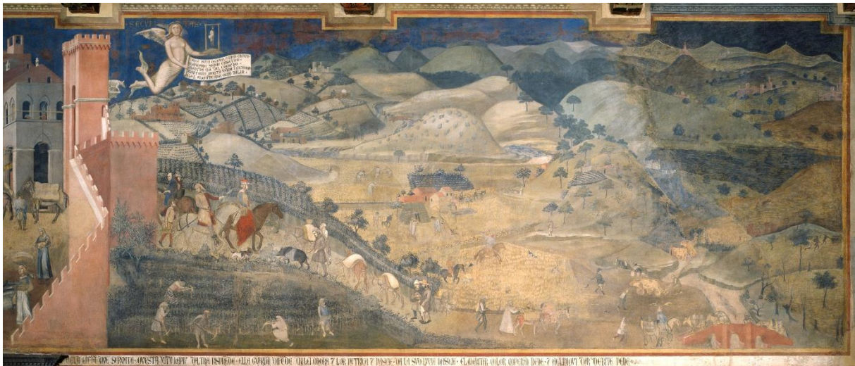
Afbeelding 4. Lorenzetti's Goed Bestuur , zijwand: de gevolgen van goed bestuur op het platteland.

Wat slecht bestuur in de stad en het ommeland teweeg kan brengen, toont ons de tegenovergestelde wand van de raadzaal (afbeelding 5). Ook daar ontwaren we de gestalte van een mooie jonge vrouw als de verpersoonlijking van de Gerechtigheid. Dit keer spant zij geen koord dat anderen in toom houdt, maar ligt zij zelf gekneveld aan de voeten van een monsterachtige duivel die de tirannie uitbeeldt en zich laat leiden door Hoogmoed, Hebzucht en Ijdelheid. Een miezerig groepje omstanders kijkt wellustig toe hoe Gerechtigheid ervan langs krijgt met een dubbele zweep. Elders in de stad wordt een vrouw beroofd en ligt het lijk van een eerwaardig burger te rotten in het stof. Geen wonder dat er in de stad verder weinig gebeurt en de meeste mensen zich angstvallig verschuilen in hun huizen. Op het platteland staan de zaken er al even slecht voor. De velden en akkers blijven onbewerkt en liggen er dor en verlaten bij. Rondtrekkende bendes steken dorpen in brand en overvallen onschuldige reizigers. Kortom: waar Gerechtigheid van haar hoge troon is verstoten resteert slechts een afschuwwekkende oorlog van allen tegen allen. Het menselijk bestaan is er eenzaam, armoedig, afstotelijk, beestachtig en kort.