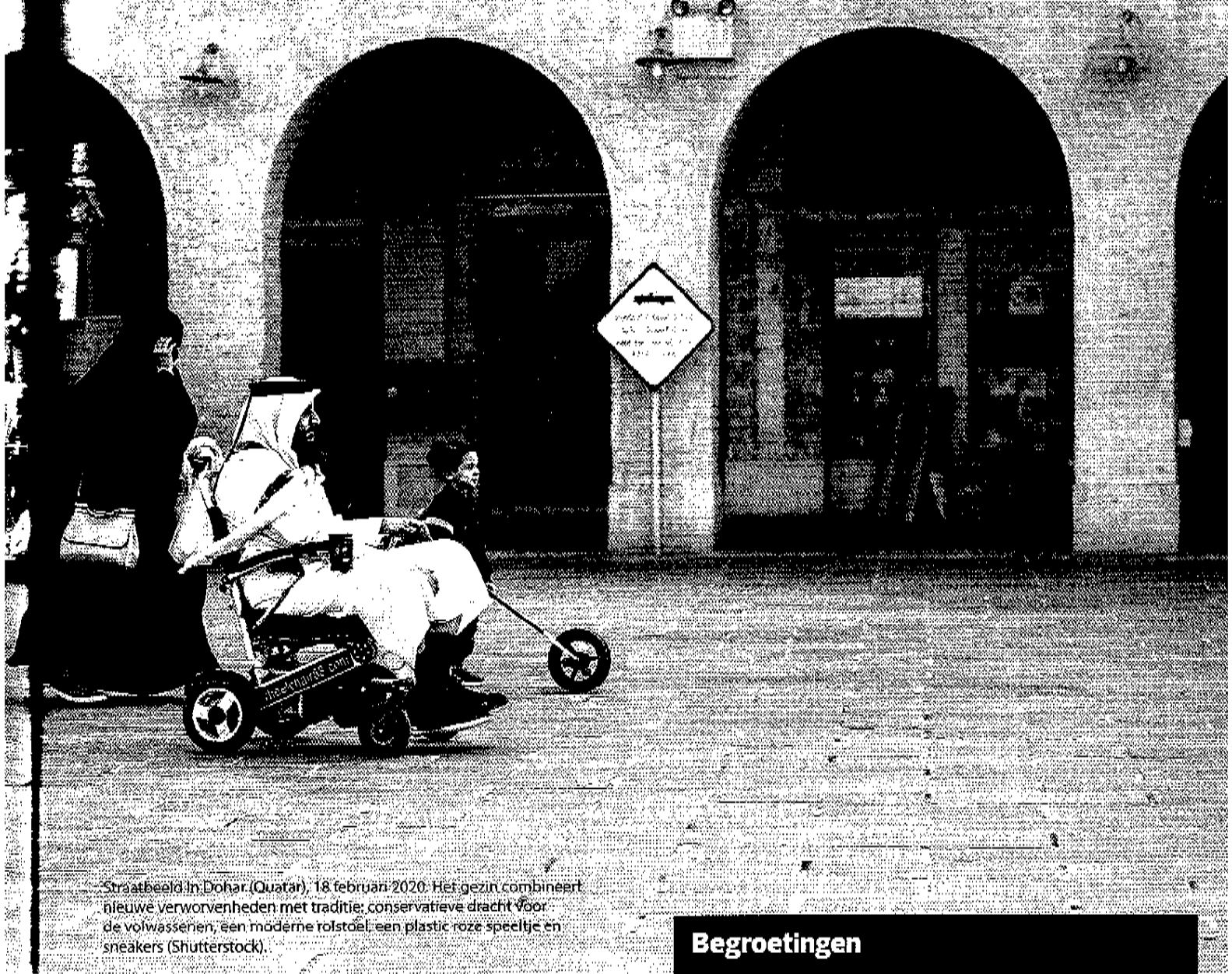
Straatbeeld in Doha (Qatar), 18 februari 2020. Het gezin combineert nieuwe verworvenheden met traditie: conservatieve dracht voor de volwassenen, een moderne rolstoel, een plastic roze speeltje en sneakers.

islam, de geschriften van moslimgeleerden, rituele praktijken en gedragsregels behoorlijk veel tegen dat volgens hen niet teruggaat op het voorbeeld van de salaf. Dat bestempelen ze dan ook als afkeurenswaardige nieuwlichterij. Zo moeten populaire praktijken onder moslims het ontgelden, zoals het aanbidden van zogenaamde heiligen (overleden geleerden of vrome gelovigen), het maken van of luisteren naar (islamitische) instrumentele muziek en het beoefenen van meditatieve rituelen. Het feit dat veel moslims zich juist vanuit een religieuze motivatie met deze zaken inlaten, maakt salafisten niet uit. Sterker nog: zelfs expliciete daden van vroomheid, zoals zes keer per dag bidden in plaats van de voorgeschreven vijfmaal, wijzen ze af. Dat deden de salaf immers ook niet.