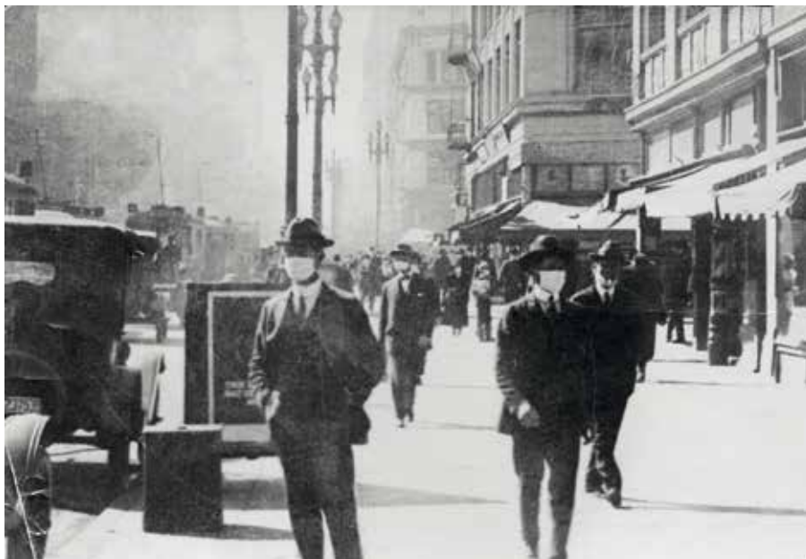
Mensen lopen met gezichtsmaskers over straat om zich te beschermen tegen de Spaanse Griep in San Francisco, 1919

vertolkte met zijn verzen de collectieve gevoelens van zinloosheid en depressie waarmee veel soldaten en burgers na de Eerste Wereldoorlog kampten. Kortom: een epidemie kan medisch gezien eindigen, maar de psychologische en sociale ontwrichting van een samenleving trekt diepere sporen. Interessant genoeg heeft het Nederlands Genootschap van Burgemeesters recent een brief opgesteld waarin wordt ingegaan op de vraag hoe burgermeesters het voortouw kunnen nemen in rouwverwerking in deze bijzondere tijd. Het Genootschap wijst op het grote belang van rituelen om gezamenlijke rouw te verwerken – zeker nu veel mensen op een andere wijze dan gebruikelijk afscheid hebben moeten nemen van hun naasten.