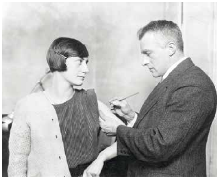
Inenting tijdens een epidemie van de pokken in Maastricht, 1927

beeld stelselmatig gepaard met het denken in termen van zondebokken, politieke onrust en maatschappelijke hervormingsbewegingen. Vanwege deze sociale dimensies stelde Richard Horton, hoofdredacteur van The Lancet , voor om COVID-19 geen pandemie is, maar een syndemie te noemen. Zo'n term benadrukt dat een pandemie niet alleen medische aspecten kent, maar dat ze ook is ingebed in een bredere, sociale en ecologische context.