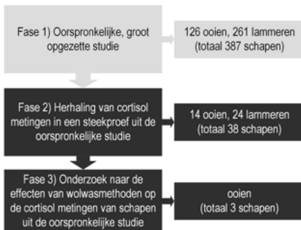
Afbeelding 1. De drie, elkaar opvolgende fasen van de studie, en het aantal ingezette schapen (ooiën en lammeren).

De cortisolresultaten, met name de enorme spreiding van waarden van het bovengenoemde experiment, gaven aanleiding tot herhaling bij 38 schapen (14 ooiën en 24 lammeren) waarbij de wolbewerking opnieuw werd toegepast. De vraag was of de extra wolbewerking vergelijkbare resultaten zou geven als bij de eerste meting. De opnieuw toegepaste wolbewerking leek een aantal metingen nogal te beïnvloeden (Afb. 3). Wij vermoedden dat de graad van vervuiling van de wol, en dus de efficiëntie van de toegepaste wolwasmethode, een oorzaak voor de enorme spreiding in de oorspronkelijke metingen was. Om dit vermoeden verder te onderzoeken hebben we vervolgens uit het bovengenoemde experiment drie ooiën geselecteerd voor het testen en vergelijken van verschillende wolwasmethoden (Tabel 1) op de hoogte en spreiding van de cortisolmetingen.