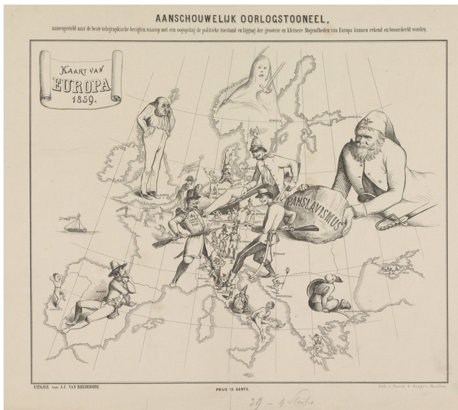
Satirische kaart van Europa, 1859.

Tekenaar onbekend, Rijksmuseum Amsterdam