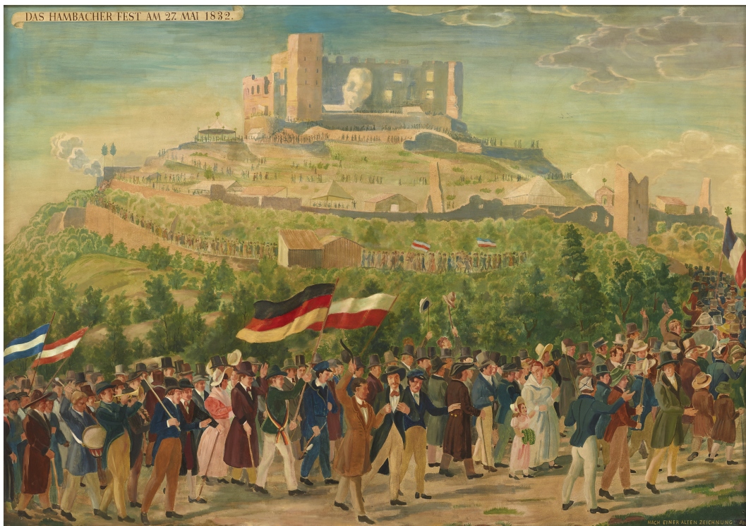
Das Hambacher Fest am 27. Mai 1832: de optocht naar het slot, met centraal de Duitse en de Poolse vlag. Vrije interpretatie van negentiende-eeuwse gravure, vermoedelijk 1948.

Schilderij door Hans Mocznay, Deutsches Historisches Museum, Berlijn