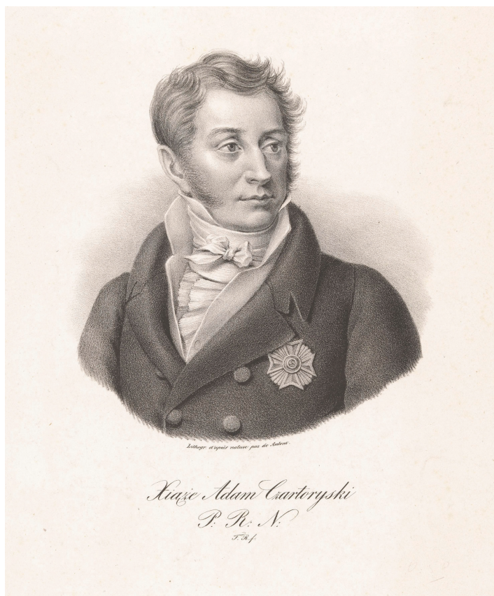
Portret van de Poolse politicus Adam Czartoryski, circa 1831.