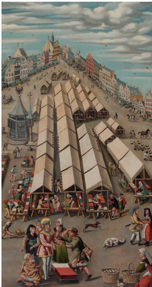
↑ De Lakenmarkt van 's-Hertogenbosch omstreeks 1530. Het huis 'Inden Salvatoer', waar Bosch woonde, is het zevende van rechts