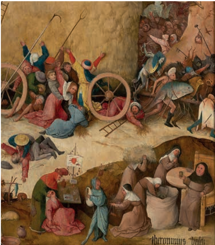
◀ Bosch was origineel. Hij beeldde met deze gewone mensen als eerste een tafereel af uit het dagelijks leven op een religieus drieluik en werd er een trendsetter mee. Detail van het schilderij 'De Hooiwagen' (1510-1516), collectie Museo Nacional del Prado Madrid.

driften en passie in te tomen. Wie Bosch' Tuin der lusten bekijkt, vallen misschien vooral de vele erotische voorstellingen op. Het lijkt een aards paradijs van lust en liefdesgenot, maar het is zeker geen loflied op de liefde. De strekking ervan is juist dat dit liederlijke gedrag een pervertering van het huwelijk betreft en zonder twijfel leidt tot een verblijf in de hel, die op de rechtervleugel is uitgebeeld. Eenzelfde boodschap zit in De hooiwagen . Op het linkerluik zien we de verdrijving uit het paradijs en rechts gruwelijke hellebeelden. Op het middenpaneel staat een grote kar beladen met hooi centraal. Demonische wezens trekken de kar voort, niet toevallig in de richting van de helse tafereelen rechts. Boven op de hooiwagen zijn twee liefdesparen te herkennen en wordt muziek gemaakt. Allerlei mensen, onder wie een vorst en een paus, proberen de hooiwagen te beklimmen of er een deel van te bemachtigen. Sommigen zijn hierin zo fanatiek dat ze onder de wielen raken en door de wagen worden geplet. Rechts-onder geniet een weldoervoede monnik van een glas terwijl grote zakken hooi worden aangevoerd. Het hooi staat voor aardse goederen, maar ook voor ijdelheid, vergankelijkheid en de dwaasheid om deze ijdelheden na te jagen en zodoende God te