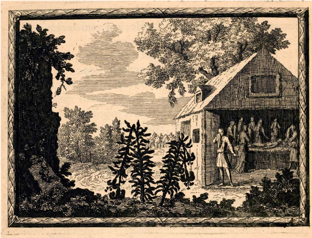
◀ 6 W. Mylius, De Veldgezangen van Thyrsis , embleem 18 (Utrecht UB, LB-KUN: RAR LMY Mylius 1).

‘Gewis, nu dat ik zelf mij voel tot haar genegen, geprikeld van een Drift, die langer niet verzwegen moet zijn; nu zal zij, op ’t ontdekken van mijn Wond, mij meêr beminnen, ik haar kussen mond aan mond.’