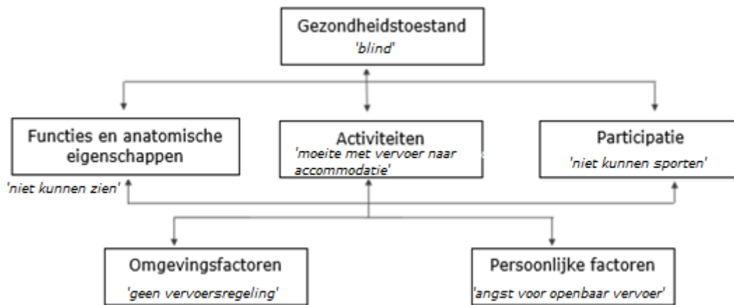
Figuur 3. Voorbeeld van het model van het menselijk functioneren.