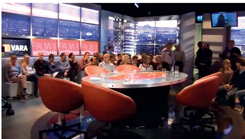
Figuur 2 De ruimte met studiopubliek en videomuren van de talkshow Pauw en Witteman (Pauw en Witteman, 2010)

De inrichting van de studio van Pauw en Witteman onderstreept het belang dat men aan nieuwsfilmfragmenten als onderdeel van tv-interviews toekent: rondom de interviewtafel bevinden zich drie grote videomuren, waarop de videoclips aan de gespreksdeelnemers en het tv-publiek getoond worden. Deze setting maakt het programma tevens zeer geschikt voor meer complexe, dus ook meer levendige, interactie, alleen al omdat het reageren op de vertoning bestanddeel van het interview wordt (Huls & Pijnenburg, 2012; Sauer, 2012).