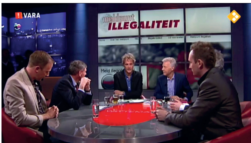
Figuur 1 Still uit Pauw en Witteman, 10 april 2012

Deze elementen vormen het multimodale (dat wil zeggen: uit verbale en visuele informatiedelen samengestelde) ‘materiaal’ waaruit de tv-interviews in feite bestaan: het ‘semiotic amalgam of the audiovisual media’ (Lauerbach, 2010, p. 132). Het effect ervan reikt verder dan het verstrekken van informatie die met behulp van verbale uitingen alleen wordt overgebracht. Het interview met de Belgische politicus Filip Dewinter van de politieke partij Vlaams Belang op 10 april 2012 illustreert dit exemplarisch. Interviewer Pauw kondigt voordat het nieuwsfilmfragment vertoond wordt alleen aan dat het zal gaan over ‘het meldpunt illegaliteit, laten we even gaan kijken’. Na afloop van de vertoning (die voor de tv-kijkers schermvullend te zien was) worden de gespreksdeelnemers als volgt in beeld genomen: