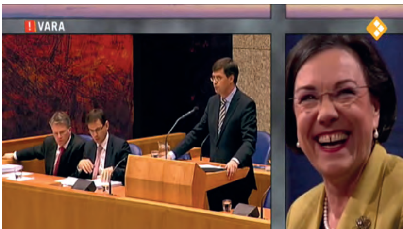
Figuur 4 Still uit Pauw en Witteman, 3 mei 2012

De verhoogde levendigheid komt voor de tv-kijkers het beste tot zijn recht als de confrontatie niet alleen na afloop, zoals bij Hennis-Plasschaert, maar ook tijdens de vertoning in beeld gebracht wordt. In de praktijk gebeurt dit door de reactie van de geïnterviewde daarop in split-screen in beeld te brengen. Dit geschiedt bijvoorbeeld wanneer aan vertrekkend Tweede Kamervoorzitter Gerdi Verbeet diverse aaneengemonteerde video-beelden vertoond worden van opvallende, vooral grappige momenten uit Kamerdebatten die zij voorzat.