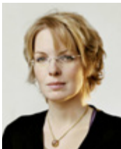
■ Beatrice de Graaf Hoogleraar Geschiedenis Internationale Betrekkingen, Universiteit Utrecht

In tien jaar tijd kan er veel gebeuren. Trends, golven, generaties en technologieën komen meestal niet uit de lucht vallen. Dat zijn ook niet de ontwikkelingen die het ons verhinderen om de hoek van de tijd te kijken. Hoewel, social media is wel heel onverwachts en snel tot wasdom gekomen. Waar Al Qaeda in 2001 nog per jeep door de woestijn met videobanden moest leuren om lokale televisiestations bereid te vinden de tapes via Al Jazeera de ether in te sturen, daar is elke IS-strijder een wandelende eigen broadcasting company. En waar het informatiemonopolie in de jaren negentig en zelfs na 2002 en 2004, na de moord op Pim Fortuyn en Theo van Gogh nog redelijk stevig bij de autoriteiten lag, daar heeft twitter de “wisdom of the crowd” een hele nieuwe dimensie gegeven. Dat is allemaal waar.