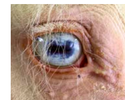
Niet met elk oog dat er 'anders' uitziet, is iets mis. Een witte iris is bij een paard met de cremello-kleur niet ongebruikelijk en dus niet afwijkend.

Veel vieze ogen met een traanstreep zijn niet zo ernstig en zullen met wat verzorging goed opknappen. Als het paard echter ook met één oog of met beide ogen knijpt of als het hoornvlies niet helder is, dan moet je met spoed een dierenarts waarschuwen. Voor paarden geldt hetzelfde als voor mensen: er kan nog heel veel worden 'gerepareerd', als je er maar snel bij bent.