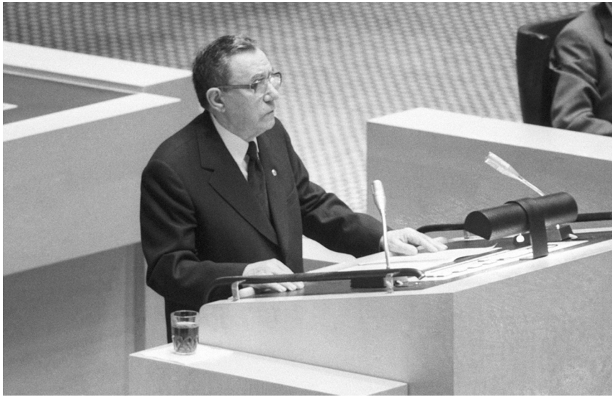
Andrei Gromyko, de minister van buitenlandse zaken van de Sovjet-Unie van 1957-1985, spreekt op de CVSE ontwapeningsconferentie – waar de Sovjets al lang voor gelobbyd hadden – in Stockholm in 1984.