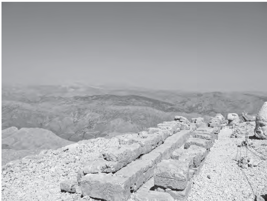
Afb. 3 Bases van de Seleucidische vooroudergalerie, Nemrut Dağı.

erfgenamen gebruikelijk – vandaar de relatief grote macht van de koninklijke vrouwen in deze dynastieën. 34 Mede op grond van deze verwevenheid was al eerder getracht de twee monarchieën samen te voegen. Cicero ( In Verrem 2.4.27) bericht hoe twee Seleucidische pretendentes, Seleucus (VII?) en Antiochus (XIII), al rond 75 v.Chr. naar Rome reisden om de Senaat te vragen hen te erkennen als erfgenamen van zowel de Ptolemaïsche als de Seleucidische diadeem (alleen het eerste verzoek werd ingewilligd). En Cleopatra's zuster Berenice IV, die van 58 tot 55 in Alexandrië regeerde, sloeg met dezelfde bedoeling een obscure Seleucidische erfgenaam aan de haak; zijn naam was Seleucus maar de Alexandrijnen noemden hem Kybiosaktes, 'visverkoper'. Voor het huwelijk kon plaatsvinden werd hij ziek en stierf – door Berenice vergiftigd vanwege zijn hufterige gedrag, vertellen Strabo (39.57) en Cassius Dio (17.1.11). Direct nodigde Berenice een andere Seleucide uit om haar gemaal te worden, ditmaal de koning-zonder-land Philippus II Philorhomaïos. Maar de Romeinse proconsul van Syrië, Aulus Gabinius, stak daar een stokje voor. Tenslotte huwde Berenice een zekere Archelaos, een vriend van Marcus Antonius die beweerde de zoon te zijn van Mithridates VI van Pontus en dus een nakomeling van Seleucus Nicator. Ook dat werd niets. In 55 viel Aulus