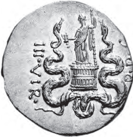
Afb. 1 Dionysus staande op een cista mystica geflankeerd door slangen. Munt van M. Antonius uit Ephese, 39 v. Chr.

leken op de Donaties van Alexandrië schonk Antonius haar het land Cyrenaica, landerijen op Kreta en verscheidene steden in de Levant. 24 Bij deze gelegenheid erkende Antonius tevens zijn eerste twee kinderen bij Cleopatra, de tweeling Alexander en Cleopatra, en verleende hun de eretitels Helios en Selene – epitheta met een sterk Seleucidisch karakter (het geschiedde dan ook in Antiochië). En last but not least werd het begin van een nieuw tijdperk van vrede en voorspoed afgekondigd met 37/6 als Jaar 1. 25 Deze jaartelling moest de Seleucidische Era vervangen (sinds 312 v. Chr.) die nog altijd in het Midden Oosten gebruikt werd. Vanaf dat moment begon ook Caesarion, de zoon van Caesar, een grote rol te spelen in de propaganda van Antonius en Cleopatra (afbeelding 2). 26