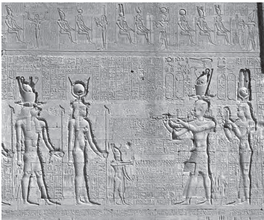
Afb. 2 Cleopatra en Caesarion (r.). Reliëf op de Tempel van Hathor in Dendera (naar Pfrommer 2002).

achter en reisde naar Alexandrië om Cleopatra de buit van zijn veldtocht aan te bieden, de Armeense koning Artavasdes gevangelijk met zich mee voerend. Deze overwinning was de directe aanleiding voor de aanname van de titel Koningin der Koningen door Cleopatra.