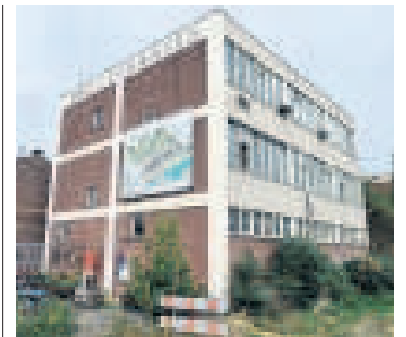
▲ De locatie aan de Eem.

Zulke maatschappelijke initiatieven zijn van grote waarde voor de leefbaarheid en toekomst van steden. Als ze, zoals De WAR, ook nog eens zichzelf kunnen bedruipen, mag een gemeente zich gelukkig prijzen. De WAR is een schoolvoorbeeld – letterlijk want wij en andere Nederlandse en buitenlandse universiteiten werken graag met ze samen als 'good practice' casus – van hoe burgers en steden een serieuze bijdrage kunnen leveren aan duurzaam-