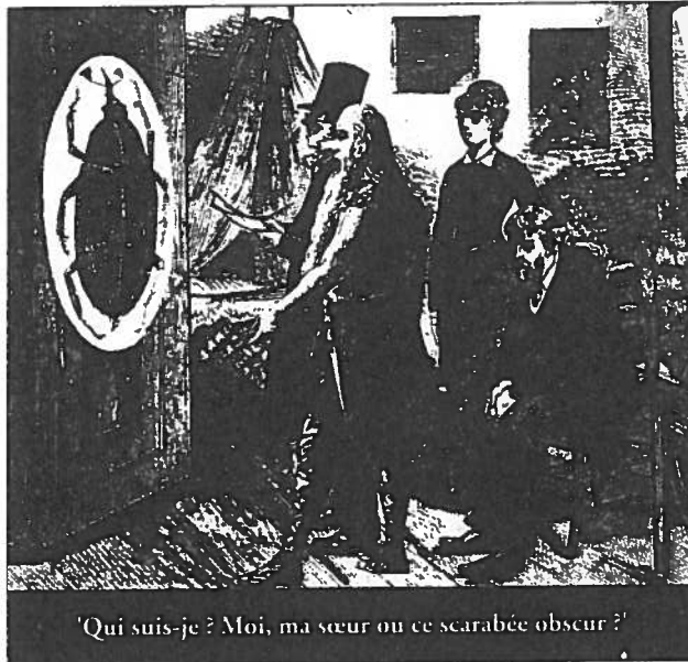
'Qui suis-je ? Moi, ma sœur ou ce scarabée obscur ?'

mobiele entiteit, een soort vleesgeworden duur, dat bestaat in en door een reeks van onderbroken transformaties en toch verbazingwekkend trouw blijft aan zichzelf. Dit soort 'trouw' moet niet worden gezien als een sentimentele afhankelijkheid aan de eigen 'identiteit', die uiteindelijk niet meer is dan een sociale identiteitskaart. Het gaat hier ook niet om een authentieke stem die zich beroept op een - doorgaans pathetisch - geloof in het belang van een uitgemergeld ego en/of de kleine behoeften en verlangens van de mens en zijn onmiddellijke omgeving. Er wordt bedoeld