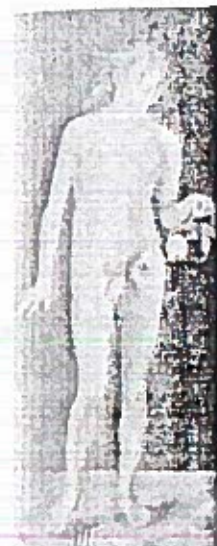
ill. 1: Albrecht Dürer, Adriano (Museo Nacional del Prado)

Voor ons is de bevestiging van de subjectiviteit van vrouwen, en daarmee het verlangen, uitgangspunt van een feministische politiek. Door het sekseverschil te vangen in een binaire oppositie kan vrouwelijke subjectiviteit alleen gedacht worden in tegenstelling tot mannelijke subjectiviteit en wordt het onmogelijk te denken over de oneindige schaal van verschillen tussen vrouwelijke subjecten: leeftijd, ras, klasse, seksuele voorkeur. Wij willen vrouwelijke subjectiviteit en vrouwelijk verlangen politiseren, door de verschillen tussen vrouwen tot uitgangspunt te nemen, met de bevestiging van het sekseverschil als doel. Hoe dit in de (tekstuele) praktijk kan werken, laten we zien aan de hand van verdere analyse van het Blauwbaardverhaal.