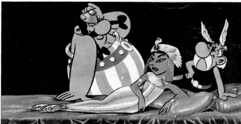
Een moderne representatie: Uderzo's Cleopatra