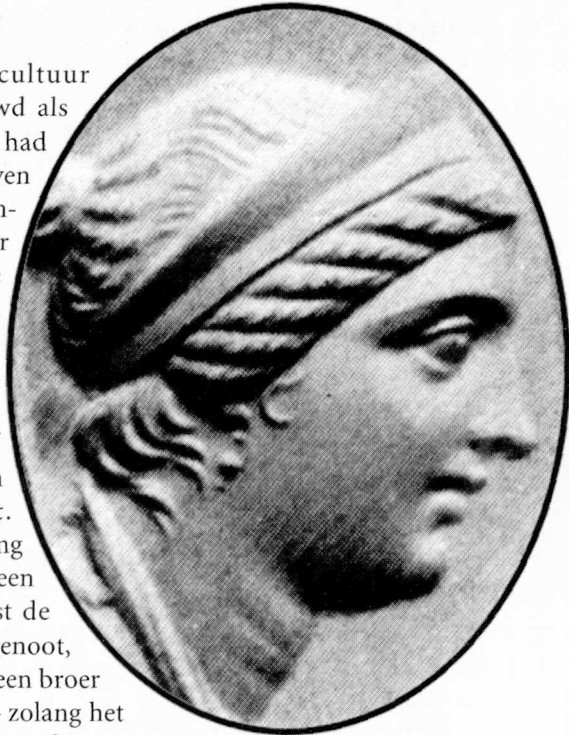
Juwel met een portret van een Ptolemaeïsche koningin, waarschijnlijk Arsinoe Philadelphus. Uit: Grace Harriet Macurdy, Hellenistic queens. A study of woman-power in Macedonia, Seleucid Syria, and Ptolemaic Egypt (Chicago 1985) afb. 4a.

Inderdaad. Als je de antieke bronnen mag geloven, dan is de ellende niet te overzien zodra een vrouw de macht grijpt. Uit de Oudheid zijn