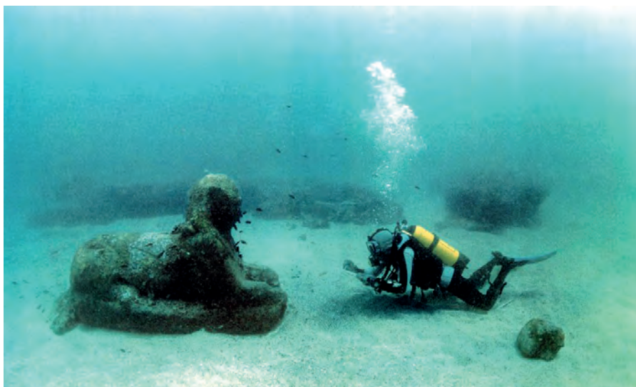
Afb. 4 Een onderwaterarcheoloog oog in oog met Egyptische sfinx (foto uit Foreman 1999).