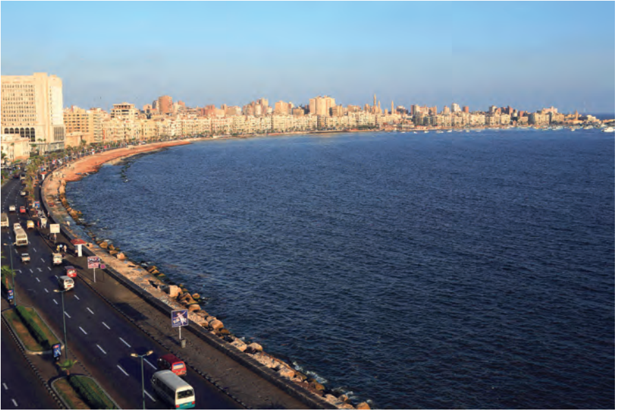
Afb. 1 De oude haven van Alexandrië.

hele kust in handen te krijgen. Vandaar het verbeten, maandenlange beleg van de weerspannige havenstad Tyrus. Vandaar ook dat het Macedonische leger na de overwinning bij Issus (333 v.Chr.) langs de kust naar het zuiden optrok in plaats van landinwaarts achter de nog onverslagen Darius aan te gaan. De stichting van Alexandrië aan het einde van deze lange mars laat zien dat het Alexander daarbij niet alleen maar te doen was om de maritieme macht van de Achaemeniden te breken, zoals in de meeste handboeken te lezen valt, maar vooral om zélf hegemonie over de oostelijke Middellandse Zee te verkrijgen: als je er alleen op uit bent marinehavens uit te schakelen ga je er natuurlijk niet nog een bijbouwen.