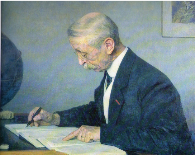
Fig. 4 Portret van J.C. Kapteyn door Jan Veth, nu in de Kapteynkamer van het Kapteyn Instituut in Groningen.

Melkwegstelsel om zijn as draait, met de zon in een van de buitenste delen. De zon had geen bijzondere plek in het sterrenstelsel.