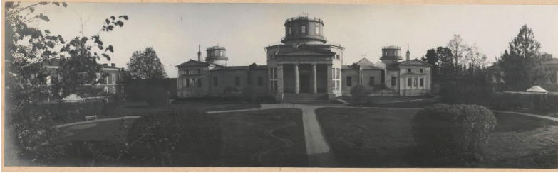
Fig. 1 De sterrenwacht van Pulkovo bij Sint-Petersburg, het voorbeeld voor veel sterrenwachten. Foto uit een fotoalbum die Hendrik van de Sande Bakhuizen bij zijn emeritaat in 1908 cadeau kreeg. Het bevindt zich nu in de Universiteitsbibliotheek Leiden.

stichtte een koninklijke of keizerlijke sterrenwacht, waar astronomen de beschikking kregen over de beste telescopen en werden bijgestaan door kamers vol gespecialiseerde rekenaars (Engels: computers). De Tsaristische sterrenwacht van Pulkovo bij Sint-Petersburg was het grote voorbeeld, met prachtige faciliteiten en een vrijwel onbeperkt budget. 7 Hemelmechanica, het berekenen van de banen van planeten en kometen, stond nog steeds hoog aangeschreven, maar de sterren kregen ook meer aandacht. Dat hing samen met de negentiende-eeuwse hang naar nauwkeurigheid en naar compleetheid bij het in kaart brengen van de wereld. Niet alleen de continenten en de wereldzeeën werden door ontdekkingsreizigers