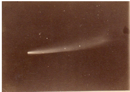
Fig. 3 Deze foto maakte Sir David Gill, Royal Astronomer at the Cape of Good Hope, in 1882. 17

Fotografie maakte grootschalige onderzoeksprojecten mogelijk, ook voor astronomen zonder toegang tot een goede telescoop, zoals de jonge professor Jacobus Cornelius Kapteyn (1851-1922) in Groningen. Hij was tot hoogleraar benoemd om onderwijs te geven, maar kreeg geen onderzoeksfaciliteiten. Er waren immers al twee sterrenwachten in Nederland: in Leiden en Utrecht. Daarom mat Kapteyn tussen 1886 en 1892 honderdduizenden sterren op foto’s die David Gill vanuit Zuid Afrika opstuurde. Kapteyns interesse ging echter verder dan plaatsbepaling alleen. Hij wilde weten hoe de sterren over de ruimte verdeeld waren (het ‘siderische probleem’, zoals hij het