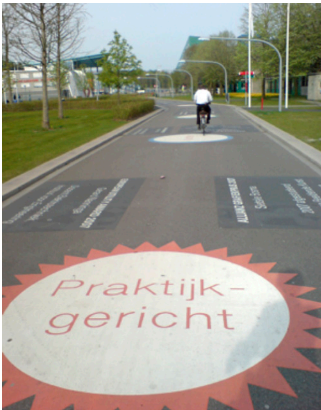
Walk of fame

Over het centrale pad over de campus in Groningen loopt een 'walk of fame'. Hier presenteert de Hanzehogeschool Groningen haar prijswinnende studenten en docenten.