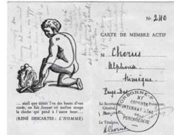
Lidkaart 11de Internationaal Psychologencongres Parijs 1938.