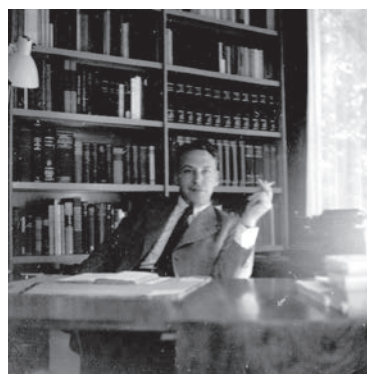
Studeerkamer Oegstgeest 1951.

Zijn hoorcolleges hield hij aanvankelijk aan een U-vormige tafel in een zaaltje aan de Binnenvestgracht, waar hij met zijn studenten bijvoorbeeld Dostojevski's Gebroeders Karamazov behandelde op diens psychologische typering van de drie broers 225 . Later was hij vanwege de aantallen gedwongen die colleges in een van de grote collegezalen in het Academieggebouw te geven, waarbij hij het betreunde dat de interactie met zijn studenten daaronder leed. De meningen van zijn studenten over zijn collegegeven liepen uiteen, maar zij vonden wél dat zijn afstandelijkheid hem belette echt meeslepend te zijn. Op zijn colleges besprak hij volgens sommige studenten geregeld vindingen van anderen, zonder er veel aan toe te voegen 226 .