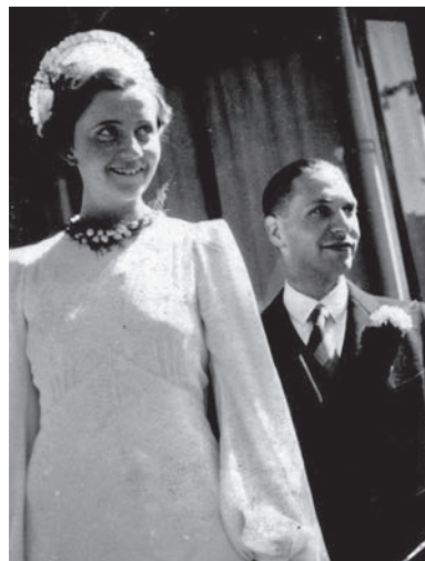
Bruiloft 30 mei 1937.