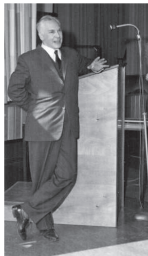
College Leiden omstreeks 1965.