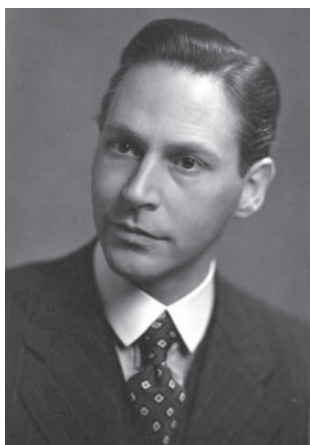
De jonge doctor in 1940.