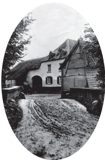
Chorushoeve Munstergeleen vanaf Geleenbrug 1930.