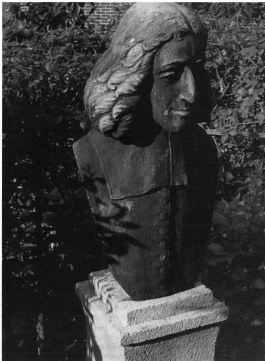
Spinozahuis Rijnsburg, borstbeeld door O. Wenckebach, foto Theo van der Werf

genlijk een soort substantieven zijn, is filosofisch wellicht interessant, maar taalkundig niet steekhoudend. Wel stelt deze reductionistische benadering Spinoza in staat zijn grammaticale presentatie van het Hebreeuws rigoureus-systematisch te ordenen.