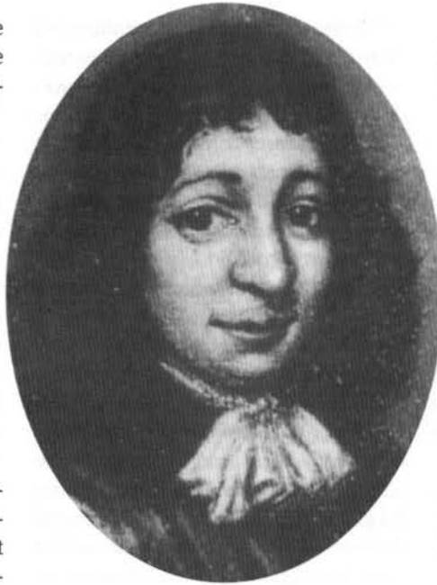
Spinoza omstreeks 1671. Schilderij van Hendrik van der Spijck (?).

Zijn onderzoek naar de waarheidsaanspraken van de theologen begint met een zeer kritische uiteenzetting over delicate bijbelse aangelegenheden als de profetie, de uitverkiezing van de Joden, en wonderen. 42 In een zorgvuldige analyse van vele aspecten van het Oude Testament wil Spinoza aantonen dat hetgeen daarin beschreven wordt, is aangepast aan het bevattingvermogen van het volk, en geen bron van filosofische of wetenschap-