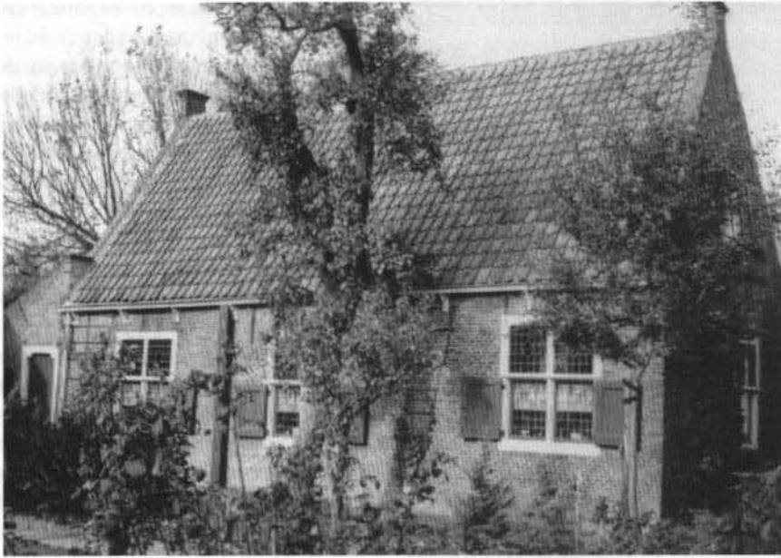
Het Spinozahuis te Rijnsburg, tuinzijde

in één oogopslag het wezen der dingen doorziet. 12 Slechts de twee hoogste niveaus, de rede en het schouwende weten, leveren adequate kennis. Alle dwaling vindt haar oorsprong op het laagste niveau, dat van de verbeelding en de empirische kennis. Niettemin is voor Spinoza dit laagste niveau een wezenlijk en onafscheidelijk deel van het menselijke kennen, de bron van alle feitenkennis en van ons hele affectieve leven. Het gaat hem dan ook niet om het uitschakelen van het laagste niveau, maar om het vergroten van het bereik van de hogere kensoorten.