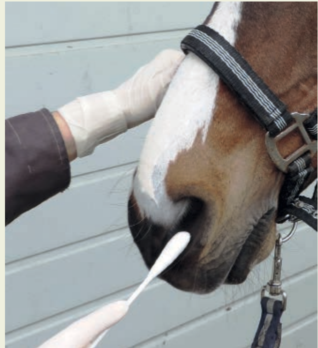
Het nemen van een neusswab.

varianten te differentiëren, leidt dit dus niet tot verschillende adviezen ten aanzien van preventie en management (14,18). Er zijn ook andere risicofactoren voor EHM beschreven: EHM wordt zelden gezien bij pony's en bij paarden jonger dan drie jaar en lijkt mogelijk wat vaker voor te komen bij vrouwelijke dan bij mannelijke dieren (10). Henninger et al. (13) toonden aan de hand van een grote EHM uitbraak in 2003 aan dat paarden ouder dan vijf jaar en paarden met een koortspiek van hoger dan 39,7 graden Celsius en/of de hoogste koortspiek op of na de derde koortsdag, in hun case-load, een significant hogere kans op neurologische problemen hadden.