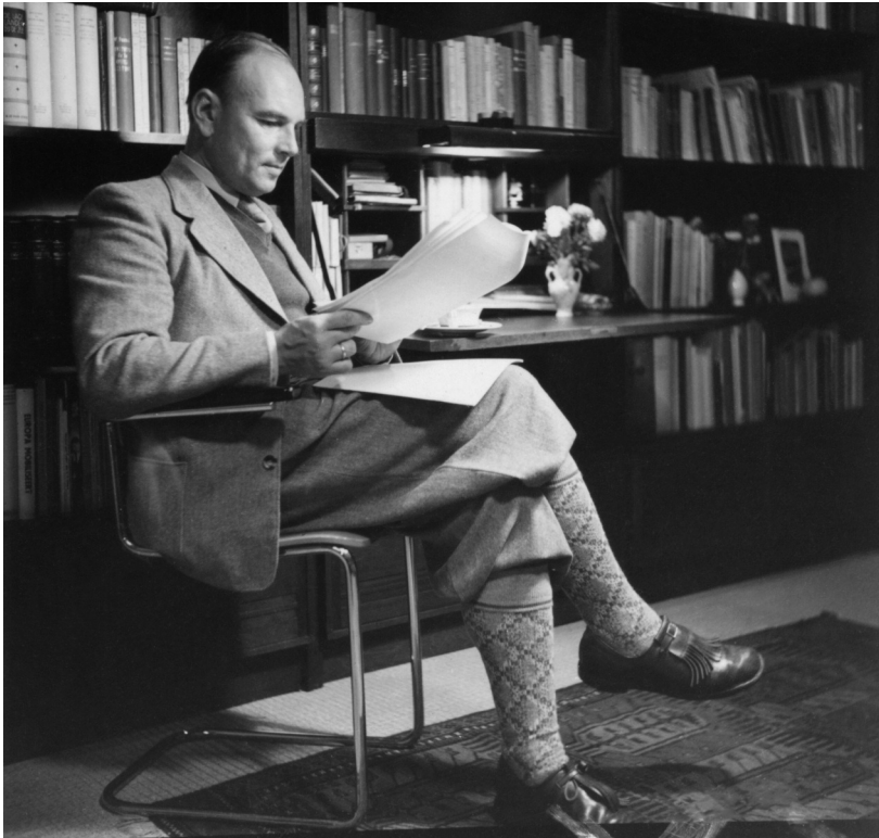
Van der Goes van Naters in zijn huis in Wassenaar, eind jaren dertig.