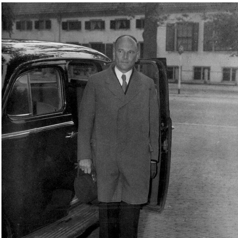
Van der Goes van Naters op weg naar bespreking met Koningin Juliana, kabinetsformatie 1948.