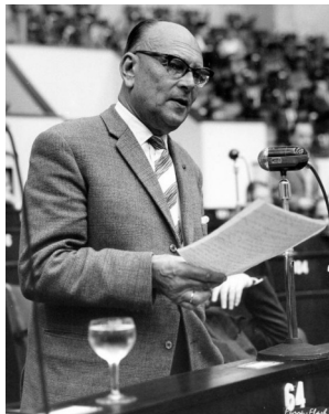
Van der Goes van Naters presenteert zijn 'Plan van Naters' in de Raad van Europa, september 1953.