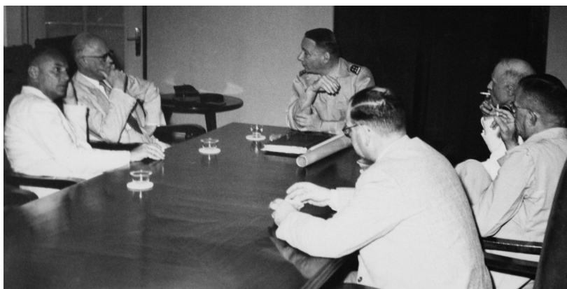
Marinus (links) met generaal Simon Spoor (midden) tijdens zijn bezoek aan Indonesië in november 1948.