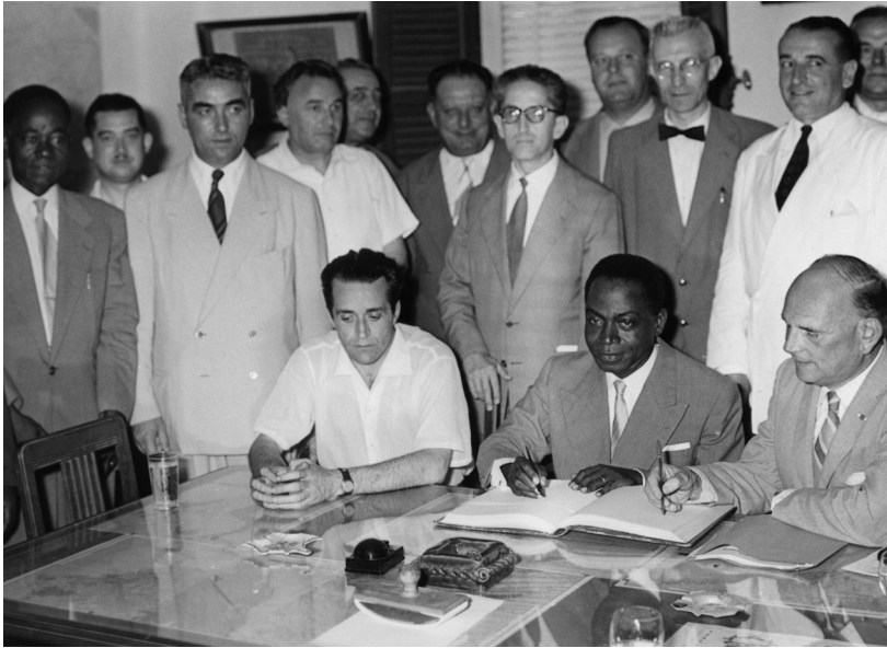
Van der Goes van Naters (rechts) met Félix Houphouët-Boigny (midden) tijdens zijn reis naar Afrika als voorzitter van het Comité d'Information et de Propagande van de EEG, Ivoorkust, 1957.