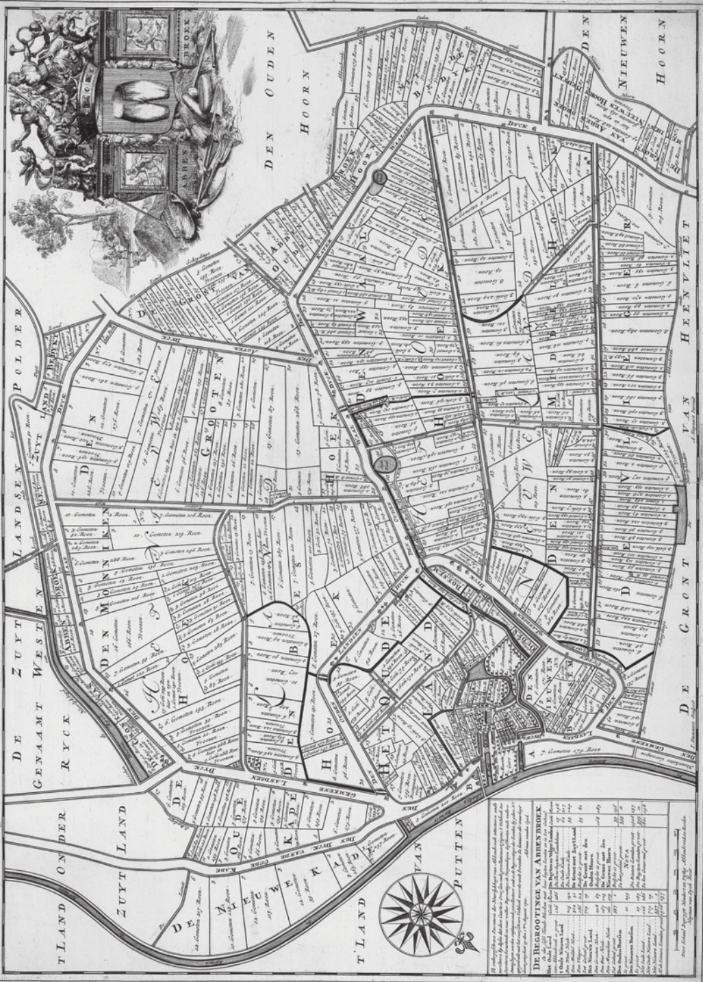
Afb. 1 Kaart van de heerlijkheid Abbenbroek. Jan Stemmers, naar ontwerp van A. Steyaart, 1701. (NA)