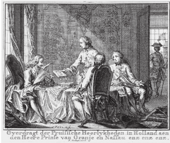
Afb. 3 Verkoop van de Pruisische heerlijkheden aan Willem V. Simon Fokke, 1754.