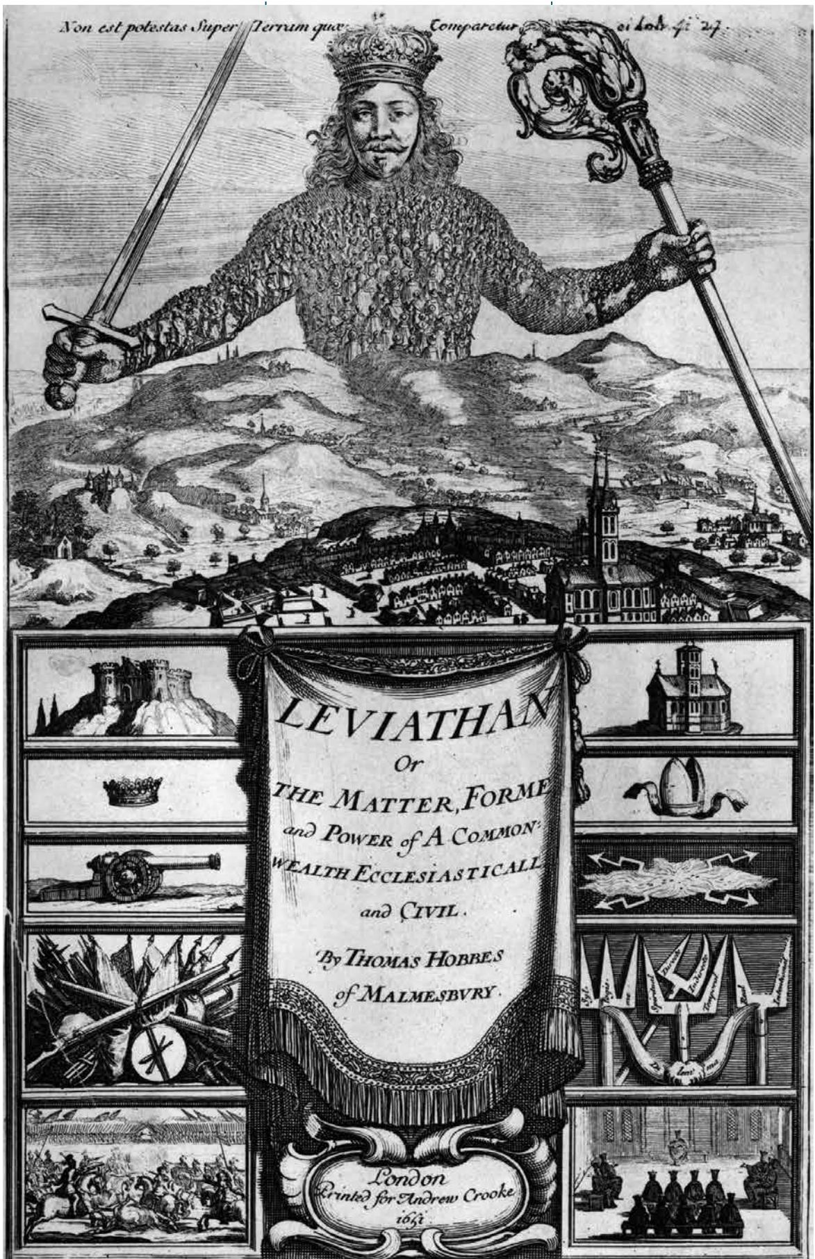
Fig. 1: Frontispies van Hobbes' Leviathan