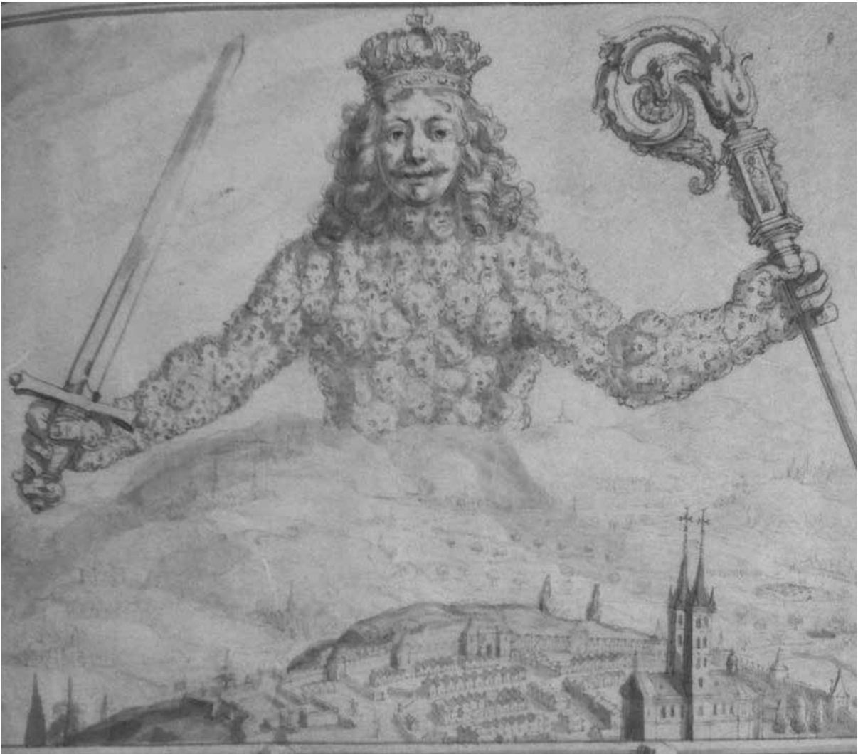
Fig. 4: detail van Hobbes' eigenhandig getekende titelpagina (British Library, ms. Egerton 1910)

Noel Malcolm, 'The Title Page of Leviathan , Seen in a Curious Perspective', in: Idem, Aspects of Hobbes (Oxford 2002), 200-233.