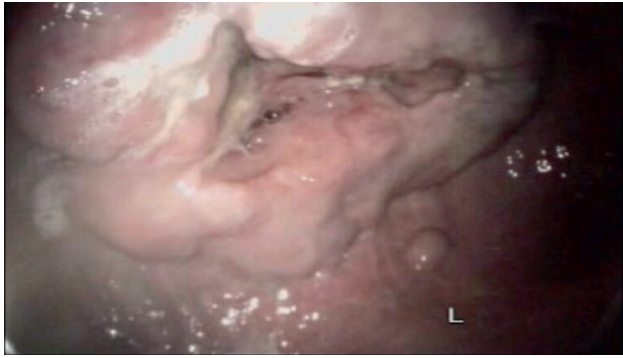
Figuur 1. Endoscopiebeeld van een maagcarcinoom in de curvatura minor in de maag van een Tervuerense herder.

langharige Schotse herder, Staffordshire, chow chow, shar pei, Groenendaeler en Mechelse herder (1, 4, 10). Een erfelijk verband voor maagcarcinoom bij de Tervuerense herder werd eerder al gesuggereerd op basis van Italiaans onderzoek (2, 3) en Amerikaans onderzoek (4, 6).