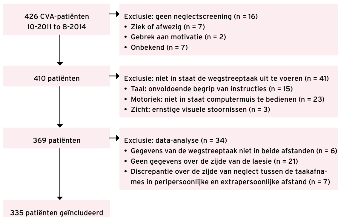
> Figuur 2. Flowchart van patiënteninlusie.

De Motricity Index meet krachtverlies in de paretische ledematen, bestaande uit drie items per ledemaat. 10 Scores lopen van 0 (geen activiteit, paralyse) tot 33 (normale spierkracht) per item. In het geval van 99 punten, wordt er één punt opgeteld om een