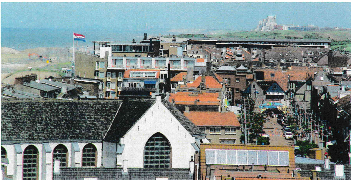
Katwijk met Noordwijk in de verte.

Ook voor metropoolregio's wil de overheid geen rigide uniforme structuur opleggen, maar juist ruimte geven aan de afzonderlijke stedelijke regio's. Dit staat niet alleen centraal in het rapport van de Studiegroep Openbaar Bestuur (SOB 2016), maar ook in de Ruimtelijke Economische Ontwikkelstrategie op »