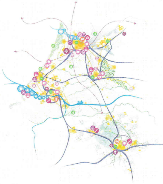
Profielkaart Ruimtelijk-economische Ontwikkelstrategie (REOS).

neerd met een positief beeld van de toekomst. De buitenwereld biedt kansen voor verdere verbeteringen waarvan een gebied gebruik kan maken, op basis van een ook voor de buitenwereld aantrekkelijk identiteitsverhaal.