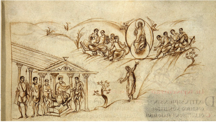
Utrechts Psalter: De Psalmist vermaant koning Saul. Universiteit Utrecht, Universiteitsbibliotheek MS 32, fól. 30r.

Staatsvorming in deze post-Romeinse wereld in het westen was mogelijk bij de gratie van een productieve overlap tussen wat ik nu maar even, kort door de bocht, kerk en wereld zal noemen. Die synergie was overigens een erfenis van het christelijke laat-Romeinse rijk, waarvan de Karolingen zich nadrukkelijk de opvolger voelden. Daarbij rijst dan de vraag wie als de echte model-keizer gold. Was het Constantijn, die in 325 in Nicea zijn bisschoppen aan de tand had gevoeld over hun rechtgelovigheid, of Theodosius de Grote, die in 390 boete deed voor zijn gewelddaden, op instigatie van bisschop Ambrosius van Milaan? 20