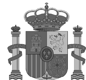
Fig. 3: Het wapen van Spanje, vandaag de dag.