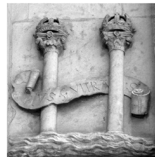
Fig.2: het wapen van Karel V, met de tekst 'plus ultra' in een wimpel tussen de Zuilen van Hercules.