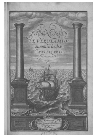
Fig. 1: Frontispies van Bacon's Instauratio magna (1620)

Toen keizer Karel V in 1516 het motto Plus ultra ('Nog verder') aannam en dit vervlocht met de zuilen van Hercules, zinspeelde hij misschien in de eerste plaats op het overtreffen van Hercules zelf in kracht en dapperheid. Karel als grotere held dan Hercules. Dat het zinnebeeld van de Zuilen van Hercules perfect past als symbool voor Karels geografische uitbreiding van zijn rijk, voorbij de grenzen van de bekende wereld, is iets wat pas later werd gevoeld. Met terugwerkende kracht is toen ook ten onrechte aangenomen dat Karel het woordje 'non' had weggehaald uit een vermeendelijk reeds bekende uitdrukking Non plus ultra die Hercules in zijn zuilen zou hebben gebeiteld. Het motto met de zuilen kende velen vormen, en uiteindelijk is het geïncorporeerd in het moderne wapen van Spanje.