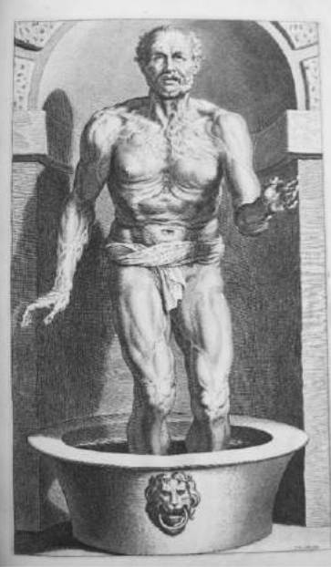
Afbeelding 8b: Cornelis Galle's gravure naar 8a.

De hele iconografie van deze editie drukte datgene uit wat Foucault betitelde als de renaissancistische episteme van overeenkomsten. Dit emblematische wereldbeeld was doordrenkt van de symboliek van de oudheidkunde zoals deze in de 16 e eeuw was opgekomen onder humanistische geleerden. Filologie, filosofie, antiquarianisme en portretkunst komen in deze edities samen. Het is duidelijk dat 'stoïcijns' niet hetzelfde betekent als 'zonder opsmuk' (Rubens heeft de naakte visser kuis van een grotere lendendoek voorzien!). De lezer werd duidelijk verlokkt door al dit vertoon. Zoals de uitgever, na de dood van Lipsius, in de tweede editie al schreef: 'De gelijkenis van het portret van Seneca moet de kijker verlokken tot de edele geschriften van dit allerverstandigste intellect'. Zie daar als aspirant-stoïcijn maar eens weerstand aan te bieden.