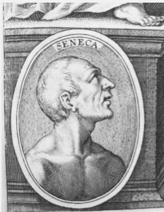
Afbeelding 2b: Seneca op het titelblad van de editie 1605