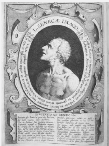
Afbeelding 3: Seneca-met-de-grote-neus

Er waren nog twee portretten van Seneca te vinden in het voorwerk van deze editie: tegenover de eerste woorden van Lipsius' Introductio , staat een portret (afbeelding 3) dat een gespiegelde en iets gedetailleerdere versie geeft van het portret op de titelpagina: