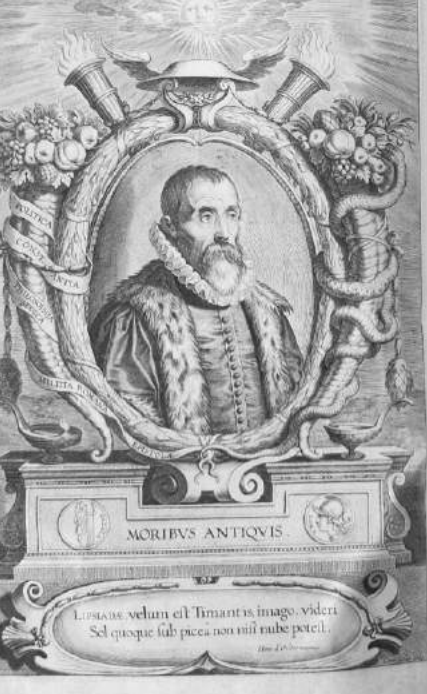
Afbeelding 7a: ed. 1632 (identiek aan de edities van 1615 en 1652): links Lipsius en rechts de titelpagina van zijn Seneca-editie.