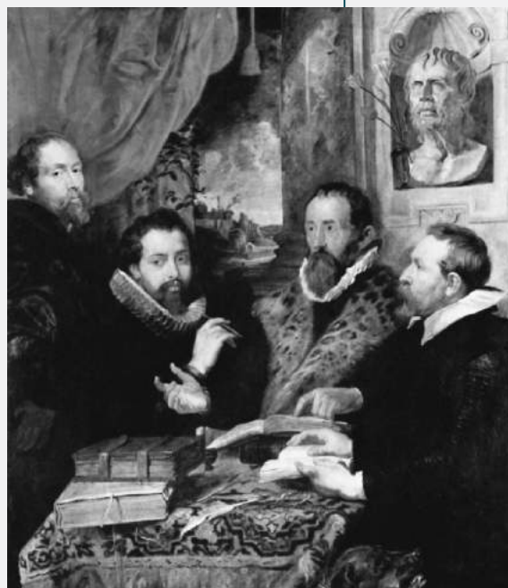
Afbeelding 7b: Peter Paul Rubens, De vier filosofen , (1611-1612)

De filoloog staat met bontjas en plooi kraag in een weelderig medaillon met guirlandes, een dubbele hoorn des overvloeds, de gevleugelde helm van Hermes onder een stralende zon en aan de linkerkant de titels van zijn belangrijkste werken: zijn Politica , het al genoemde De Constantia , de eveneens bovengenoemde werken over de stoïsche filosofie, zijn oudheidkundige werk over het Romeinse leger, en zijn brieven. In de sokkel zien we nog rondjes met Deugd en Rome, met tussen hen Lipsius' motto 'moribus antiquis' ('Volgens de zeden van de oudheid') en daaronder nog een vers. Rubens tekende het portret naar zijn eigen schilderij uit 1611-1612, 'De Vier Filosofen', dat nu in het Palazzo Pitti in Florence hangt: