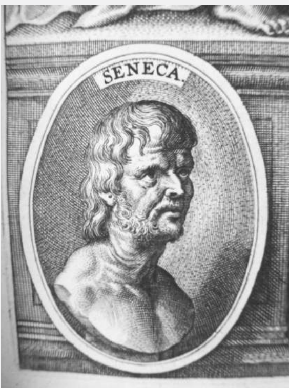
Afbeelding 7c: De nieuwe Seneca op het titelblad

De hele iconografie van deze editie drukte datgene uit wat Foucault betitelde als de renaissancistische episteme van overeenkomsten. Dit emblematische wereldbeeld was doordrenkt van de symboliek van de oudheidkunde zoals deze in de 16 e eeuw was opgekomen onder humanistische geleerden. Filologie, filosofie, antiquarianisme en portretkunst komen in deze edities samen. Het is duidelijk dat 'stoïcijns' niet hetzelfde betekent als 'zonder opsmuk' (Rubens heeft de naakte visser kuis van een grotere lendendoek voorzien!). De lezer werd duidelijk verlokkt door al dit vertoon. Zoals de uitgever, na de dood van Lipsius, in de tweede editie al schreef: 'De gelijkenis van het portret van Seneca moet de kijker verlokken tot de edele geschriften van dit allerverstandigste intellect'. Zie daar als aspirant-stoïcijn maar eens weerstand aan te bieden.