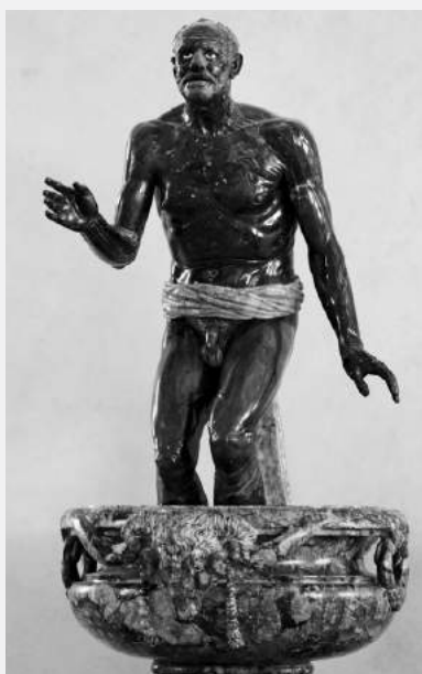
Afbeelding 4a: Stervende Afrikaanse visser (ps.-Seneca)

Seneca kijkt omhoog; volgens Lipsius (wiens beschrijving in de ovale omlijsting is opgenomen) is het Seneca, die op het moment van zijn dood 'iets levendigs, fels en vurigs' uitdrukt. Eronder staat een Latijns gedicht van Lipsius, een 'Uitnodiging tot Seneca'. Lipsius was hier evenmin over te spreken: in zijn eigen exemplaar schreef hij in de kantlijn dat het gedicht in te kleine letters was afgedrukt en dat Seneca zelf ook niet goed was afgebeeld: 'zijn neus is groter dan nodig en hij ziet er veel te jong uit'. Deze twee bustes waren gemodelleerd (maar niet zo precies) op het bovenste gedeelte van een beeld dat destijds in het bezit was van kardinaal Scipione Borghese in Rome. In feite stelt dat beeld niet Seneca voor, maar een stervende Afrikaanse visser. Vandaag de dag is het beeld te zien in het Louvre (afbeelding 4a). De man heeft inderdaad een forse neus (zie afbeelding 4b).