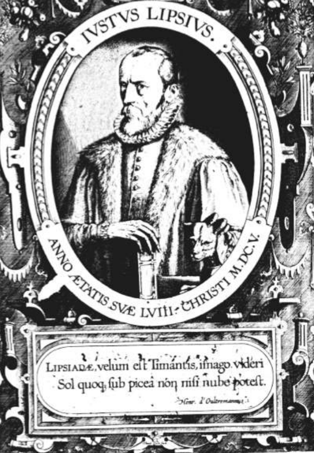
Afbeelding 1: De nog jonge Lipsius

Tegenover de titelpagina zien we dan allereerst (afbeelding 1) een portret van Lipsius. Zijn ene hand rust op de kop van een hond (Lipsius schreef graag over zijn geliefde honden) en de ander op een gesloten boek. Lipsius zelf was overigens niet tevreden over dit portret.