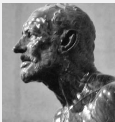
Afbeelding 4b: Detail stervende visser