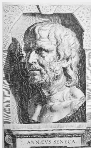
Afbeelding 9: De oude Seneca, door Rubens ontworpen.