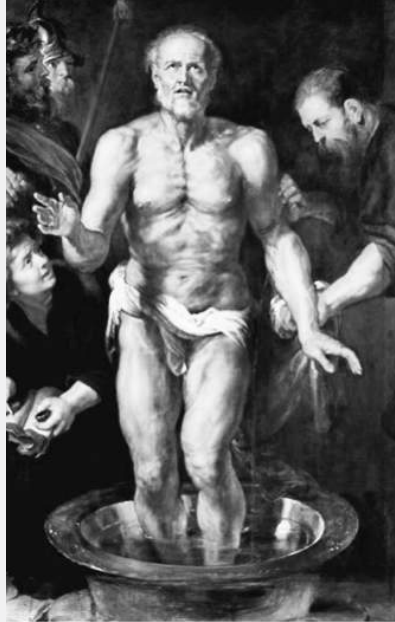
Afbeelding 8a: Rubens' schilderij van Seneca stervend in bad