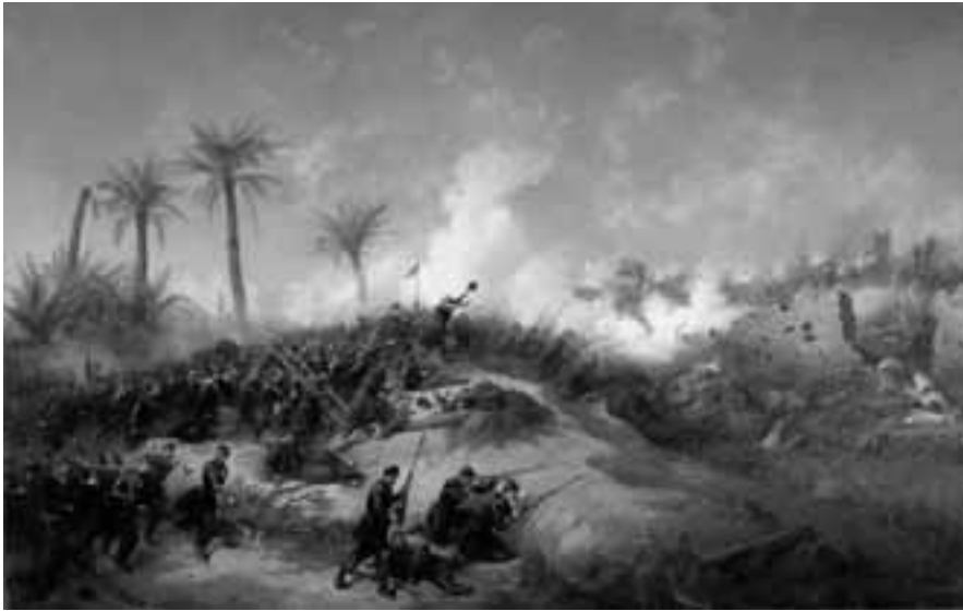
De precedent van terreur? De Franse kolonisatie van Algerije. Jean-Adolphe Beauce, Prise d'assault de la Zaatcha (1849)