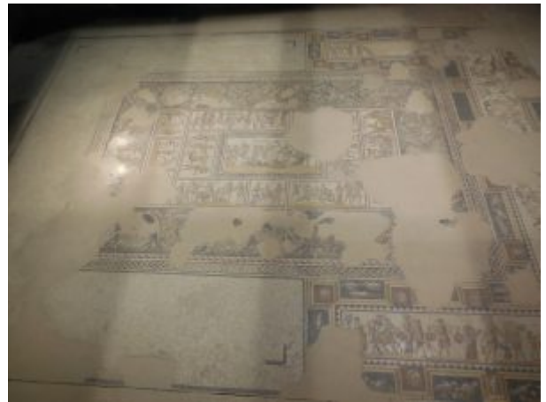
Mozaïekvloer uit het Dionysushuis in Sepphoris