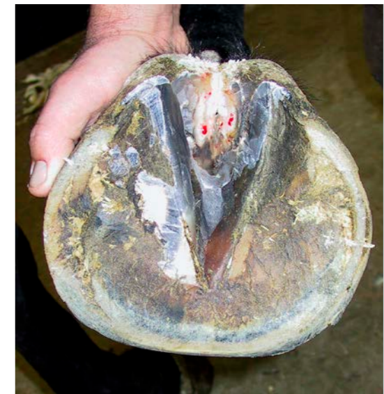
Bij deze voet sneed de hoefsmid beginnende hoefkanker weg.

paarden in boxen staan en niet in stands) en soms lukt het door het onwillige karakter van het paard minder goed om de achtervoeten regelmatig uit te krabben.