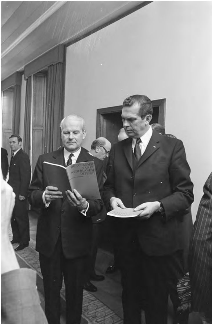
Premier Barend Biesheuvel (rechts) en minister Hans de Koster bestuderen het rapport van de Commissie-Van Rijckevorsel na afloop van de presentatie van het rapport, 27 maart 1972.