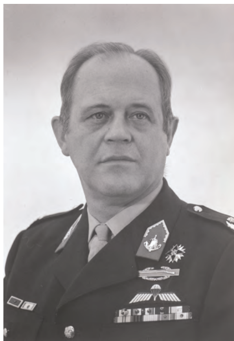
Brigade-generaal 'Bill' Clumpkens, 1973

De VVD 'kreeg' het behoud van de operationele sterkte en de KVP een verlaging van de defensie-uitgaven. Biesheuvel zag het plan als misschien wel de 'enige manier om onze coalitiepartners op één noemer te krijgen'. 52 Volgens Ringnalda moest Biesheuvel nu snel stappen richting de minister van Defensie ondernemen. Op zijn advies schreef de premier De Koster een brief waarin hij zijn zorgen uitte over de 'verhitting van de discussie' rondom het rapport-Van Rijckevorsel en dat hij voornemens was Meijnderts en een van zijn ondercommandanten uit te nodigen.