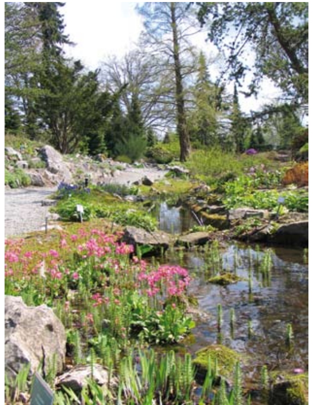
Een impressie van de rotstuin.

Natuurlijk mag u een introducté meenemen, wij vragen u alleen om u tijdig op te geven voor deze dag. Zie hiervoor het bijgevoegde opgaveformulier.