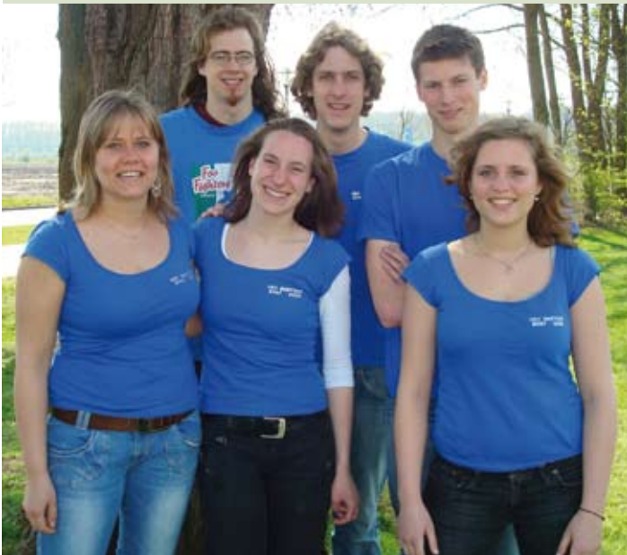
Het bestuur van UBV, trouwe helpers bij het samenstellen van brieven en het verzenden van Trésor Nieuws.

Het beheerplan en het werkplan geven duidelijk richting aan voor de activiteiten voor de komende vijf jaar. In die tijd zullen ongetwijfeld de nodige successen worden geboekt: een bescheiden toename van grotere zoogdieren als de tapir, meer kennis van de biodiversiteit en de dynamiek van dit unieke stukje tropisch regenwoud, een grote betrokkenheid van de lokale bevolking en een warme belangstelling van donateurs. Maar natuurlijk zullen er ook tegenslagen zijn. Het beheerplan is dan een belangrijke basis voor een evaluatie van het in de afgelopen jaren gevoerde beheer: wat heeft goed gewerkt, waar zitten verbeterpunten, en hoe gaan we dat aanpakken. Maar dan zijn we al weer bij het beheerplan 2012- 2016!