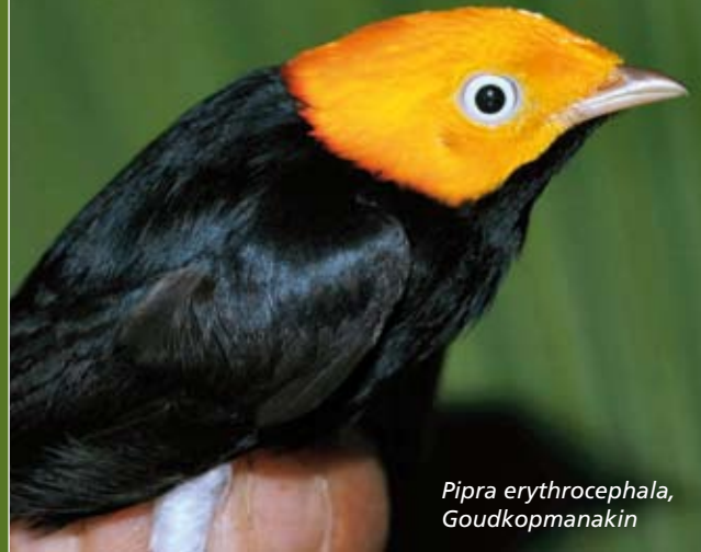
Pipra erythrocephala , Goudkopmanakin