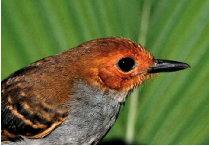
Hylophilax poecilonotus, Schubrug miervogel