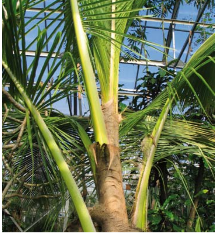
De tropische kassen brengen de imponerende flora van Zuid-Amerika dichterbij