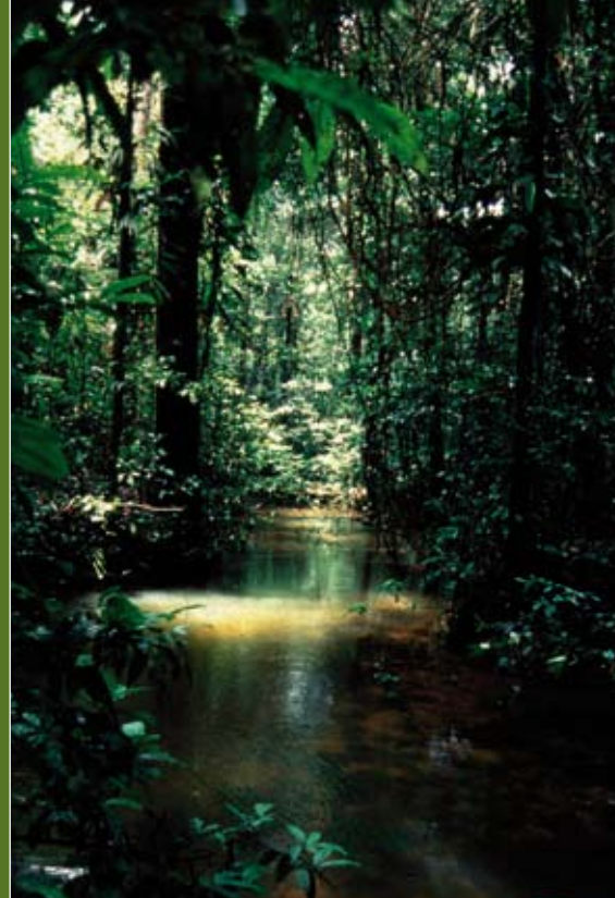
De Crique Favard