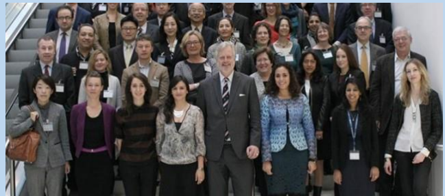
25 november 2014, Parijs, Water Governance Initiative OECD