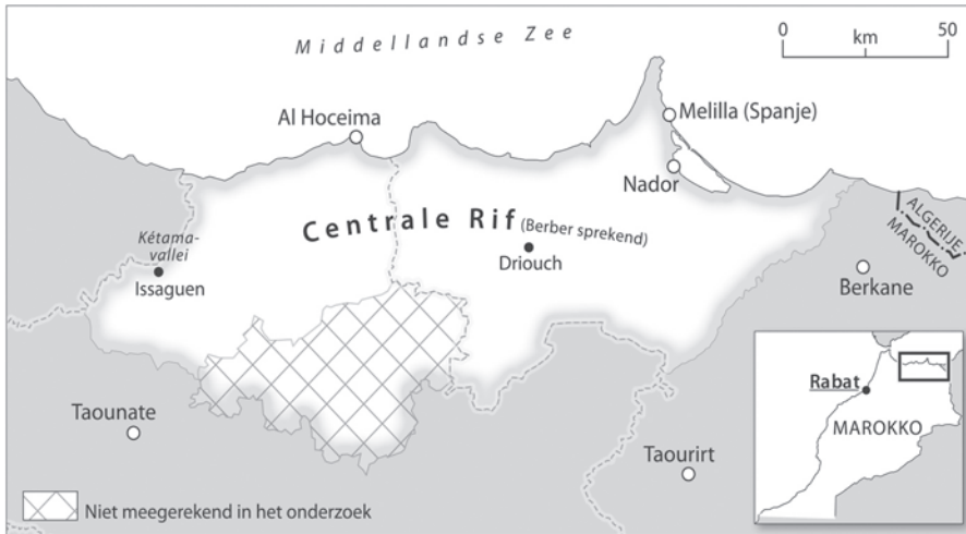
Figuur 2 Het Rifgebied

dige woonplaats. Om te achterhalen of er voor leeftijd sprake is van een niet-lineair verband, is naast deze variabele ook het kwadraat ervan in de analyse meegenomen. Voor de positie in het huishouden is onderscheid gemaakt tussen kinderen en overige huishoudensleden die deel uitmaken van een tweeouderhuishouden (referentiegroep) of van een eenouderhuishouden. Verder worden onderscheiden: alleenstaanden, partners in (echt)paren zonder kinderen en partners in (echt)paren met kinderen. Er is nog een gemêleerde categorie 'overig', die bestaat uit alleenstaande ouders, personen in instellingen en tehuizen, en enkele andere restgroepen. Wat de mate van stedelijkheid betreft, zijn de volgende categorieën onderscheiden: zeer sterk stedelijk, sterk stedelijk, matig stedelijk en weinig tot niet stedelijk (de referentiegroep).