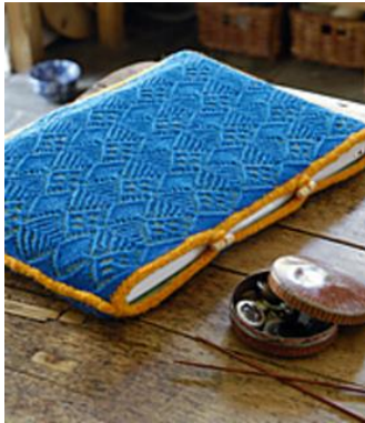
Figuur 5 Gebreide hoes voor iPad

voorbeeld hiervan is het hoesje voor een iPad met een bovenkant in kantpatroon in figuur 6. 160 Ook nieuw zijn de producten van het wildbreien,