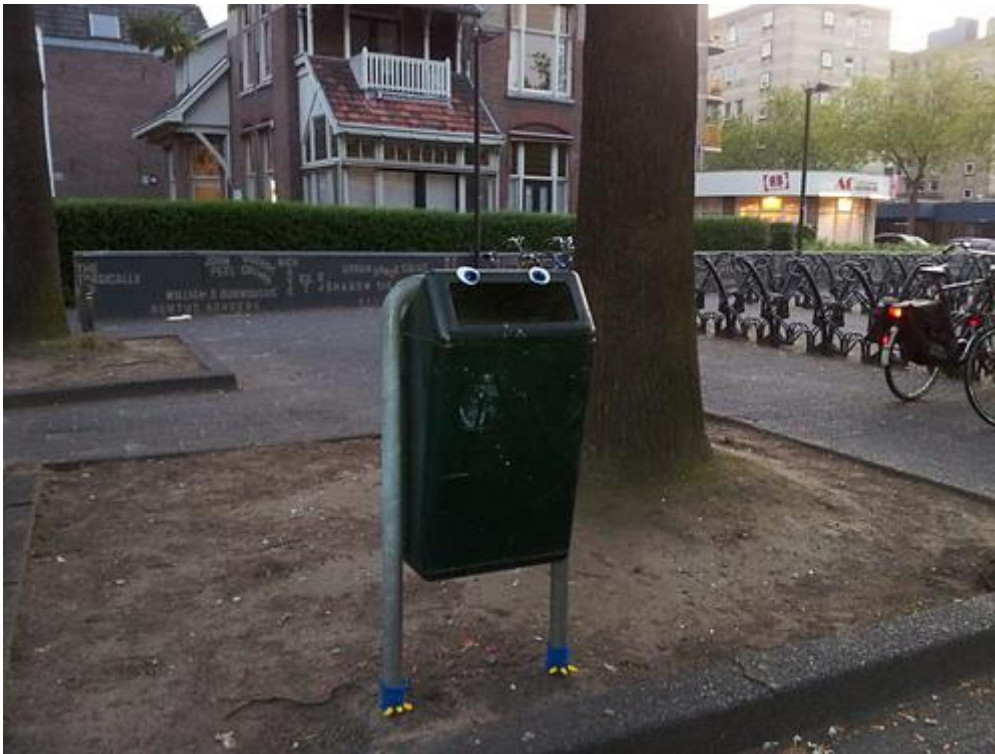
Figuur 3 Nederlands voorbeeld van wildbreien © thirteendiana op www.ravelry.com

tegelijktijd werd het door het toegenomen autobezit aantrekkelijker om vaker uitstapjes te maken of op vakantie te gaan. Hierdoor bleef er minder tijd over voor handbreien, terwijl het om financiële redenen ook steeds minder aantrekkelijk begon te worden. Wie toch bleef breien deed dit omdat zij daar voldoende tijd en geld voor had en omdat zij er plezier in had. Dit betekende dat het element nut bij het handbreien een steeds kleinere rol ging spelen. Het plezier kwam in toenemende mate voorop te staan en dat had gevolgen voor de breiwerken die er gemaakt werden. Het meest extreme en meest recente voorbeeld hiervan is het 'wild breien'. Een bescheiden voorbeeld hiervan vormen de prullenbakvoetjes in figuur 3.