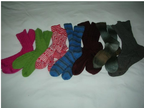
Figuur 4 Rechts een heel oude sok met daarnaast voorbeelden van moderne gebreide sokken

Om de hiervoor vermelde reden zou het kunnen zijn dat er in dit onderzoek een lacune is geconstateerd die zich in werkelijkheid niet voordeed. Maar er is nog een andere reden voor het niet voorkomen van patronen voor bepaalde breiwerken in de onderzochte tijdschriften. Een voorbeeld hiervan wordt gevormd door patronen voor sokken. Tussen alle breipatronen in de onderzochte tijdschriften zaten slechts enkele patronen voor sokken. Deze stonden vooral in de nummers van tijdschriften die aan het eind van het jaar verschenen en waarin altijd veel cadeautjes werden gepresenteerd.