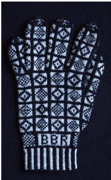
Figuur 1 Tweekleurige handschoen

In de vijftiende en zestiende eeuw had breien zich over een groot deel van Europa verspreid. Een uitzondering vormden de Scandinavische landen. Omdat gebreide artikelen steeds belangrijker werden voor de handel, werden er allengs ook gilden opgericht die de belangen behartigden van de mannen die het breien als ambacht uitoefenden: al aan het begin van de vijftiende eeuw in Tournai in Frankrijk en pas aan het begin van de zeventiende eeuw in Wenen. Aanvankelijk werd er vooral hoofdbedekking gebreid. Kousen kwamen hier later in groten getale bij. 32 Ook in Centraal Europa vond een omslag plaats van breien als beroepsuitoefening binnen de gilden door mannen naar breien als huisvlijt door vrouwen. 33