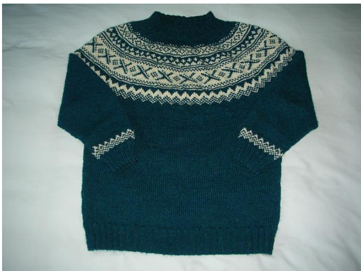
Figuur 2 Fair Isle trui

Er bestond geen vast handwerkprogramma en dus kon de leerstof worden aangepast aan de maatschappelijke omstandigheden van de leerlingen. Voor de arbeidersmeisjes werd het leren breien, stoppen en verstellen van groot belang geacht. Wat betreft